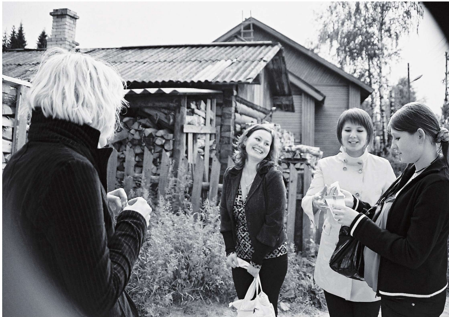
Koigorti ehk vene keeli Koigorodoki tüdrukud tunnevad end külatänaval kui kalad vees.

Kokkuvõtteks tahaks öelda, et komi noored leidsime me siiski üles, kuigi oli suvi ja koolivaheaeg. Tegu oli pilootprojektiga ja seega tegime endale alles teed selle teema uurijatena.