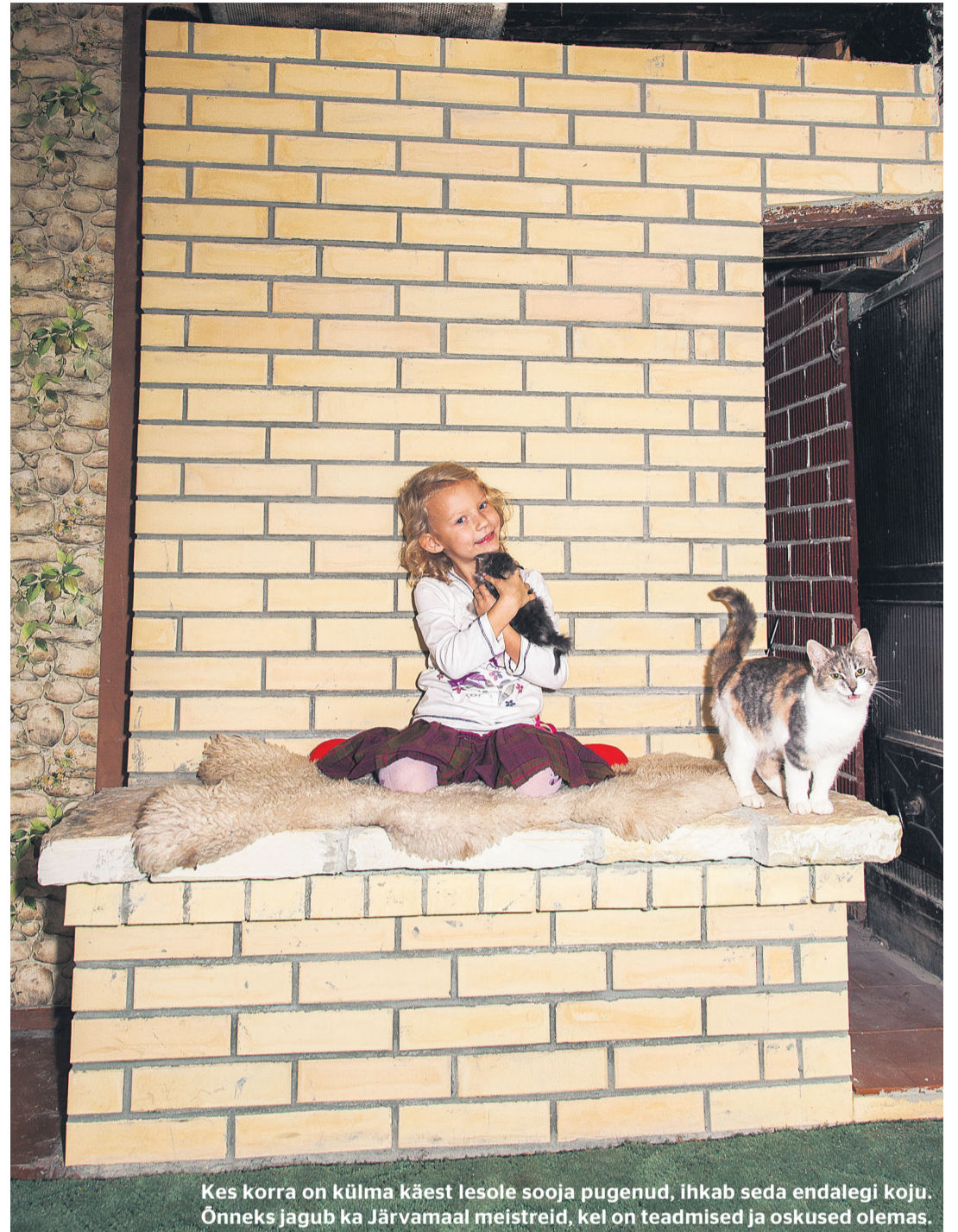
Kes korra on külma käest lesole sooja pugunud, ihkab seda endalegi koju. Õnneks jagub ka Järvamaal meistreid, kel on teadmised ja oskused olemas.

Arvestama peab veel sellega, et pottseppadel on järjekord. Tavaliselt vähemalt paar-kolm kuud, aga mõnel ka pool aastat või kauemgi.