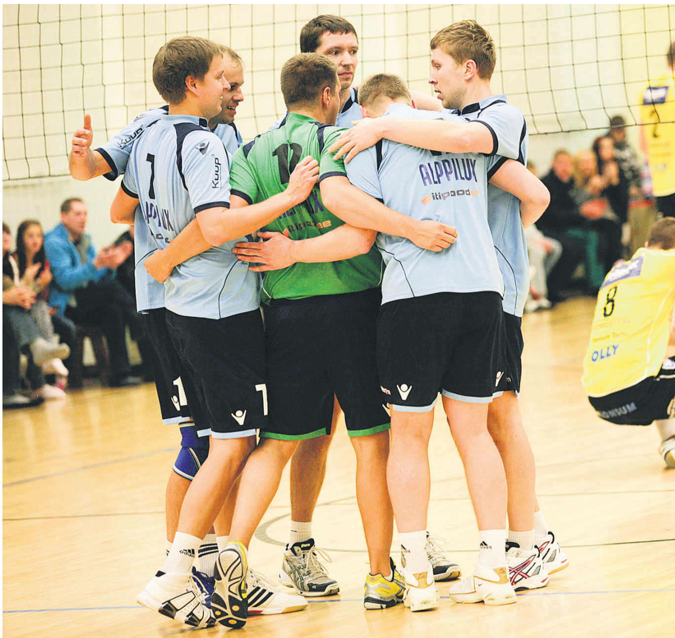
Paide/Türi/Väätsa võrkpallimeeskond alustas uut liigahooaega kolme järjestikuse võiduga. Võrreldes möödunud aastaga on võistkond asjaosaliste sõnul meistrivõistlustel välja tulnud tunduvalt tugevama koosseisuga. DMITRI KOTJUH

N60 (8 kg): I (naiste üldarvestuses III) Saima Saar rebis 239 korda.