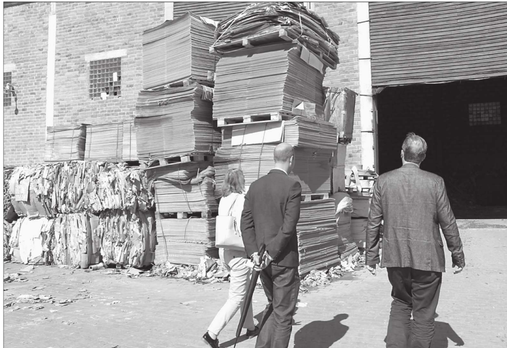
Räpina Paberivabrik on sel aastal saanud kolm rahvusvahelist ISO standardit ning ka rahvusvahelise taaskasutatud paberi FSC Recycled 100% standardi.

Lõuna Pagarid tutvustasid avatud uste päeval oma kanepitoodete sarja. Viie