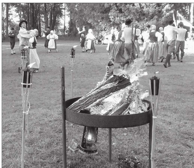
Tuli on ikka sümboliseerinud vabadusiha.

«Meie taasvaba Eesti riik on juba 25-aastane. Ühe noore inimese eluaeg jagu. Oleme vahel nii karmid oma noore riigi ja enda vastu, sest meie olemegi riik. Meil on kasvuraskused ja oleme unustanud uhkuse olla eestlane. Aga uhkust on meie oma lauludes, meie oma tantsudes ja meie lootustes. Meie