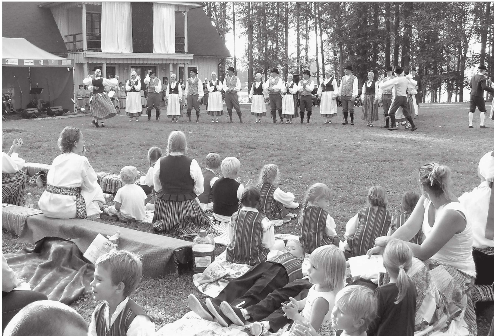
Kõigil pidudel on teiste hulgas kaasa teinud Vastse-Kuuste Kooli lapsed.