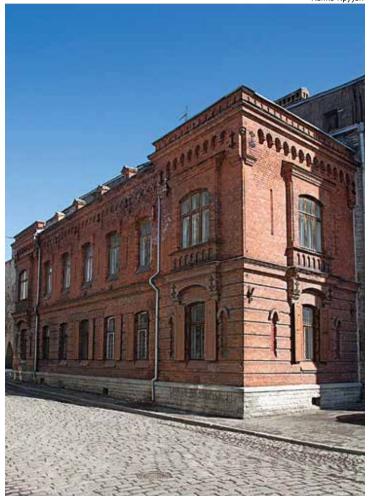
Дом без дверей – часть замка со стороны улицы Вене. Внутри можно попасть через дверь в городской стене.

Некоторые дома играют с нами и нашей памятью в прятки. Существование одного такого здания на улице Уус для большинства таллиннцев является настоящим открытием.