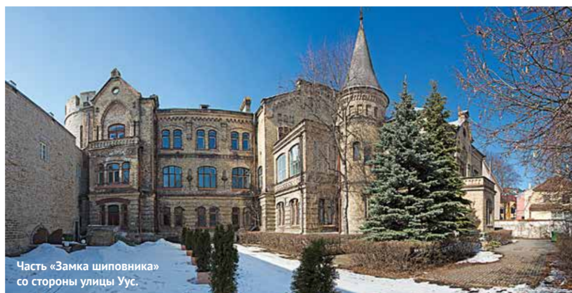
Часть «Замка шиповника» со стороны улицы Уус.

Когда я в одно солнечное апрельское утро поджидал во дворе замка фотографа, меня поразила царящая там тишина и нагоняющий сон покой. Казалось, что в доме нет ни души. Но тут отворилась дверь, и девушка в красной курточке пригласила нас войти. Поднявшись по романтической винтовой лестнице, мы оказались в большой комнате с пыльными окнами, паркетными полами и двумя паль-