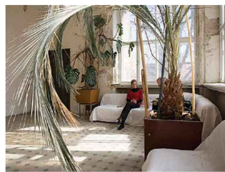
Пальмовый зал напоминает барский зимний сад.