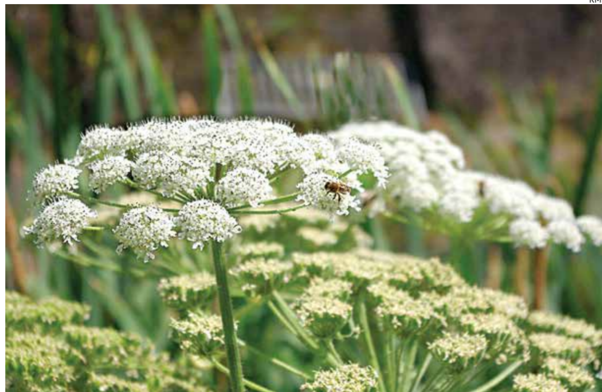
Всем известно, что в «Красную книгу» заносятся исчезающие виды. А что занесено в «Черную книгу» растений Эстонии?

Новостью нынешней викторины являются отдельные комплекты вопросов для учеников с 1-го по 4-й класс и с 5-го по 12-й класс. Хотя в прошлые годы викторина была предназначена для учеников 5-12-х классов, по словам Нельяндик, участие принимали также и младшие классы, показывая очень удачные результаты. Теперь RMK подго-