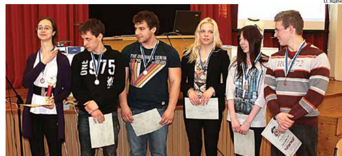
Команда «Nazvania.net» дважды становилась чемпионом нынешнего сезона игр.

По итогам 8 игр чемпионом стала команда «Nazvania.net», игравшая довольно ровно в течение всего сезона, трижды став победителем игры «Что? Где? Когда?» среди 11-12-х классов, трижды заняв 2-е место и дважды – 3-е место. Хорошая игра на последнем турнире позволила команде «Искр@» обойти лидировавшую до этого команду «Ботаники» и занять 2-е место, оставив соперников довольствоваться третьим. Что интересно, в Молодежном кубке мира, вопросы которого мы разыгрывали в 7 играх из 8, наиболее высокую позицию заняла именно команда «Ботаники» – 95-е место из 562 команд, что одновременно является третьим результатом по Эстонии. Команда «Nazvania.net» расположилась на 116-й строчке турнирной таблицы (5-е место по Эстонии), а команда «Искр@» – на 155-й. Данная ситуация связана с тем, что в Молодежном кубке мира из 7 туров зачислялись только 5 лучших результатов. Среди 9-10-х классов фаворитами игры «Что?