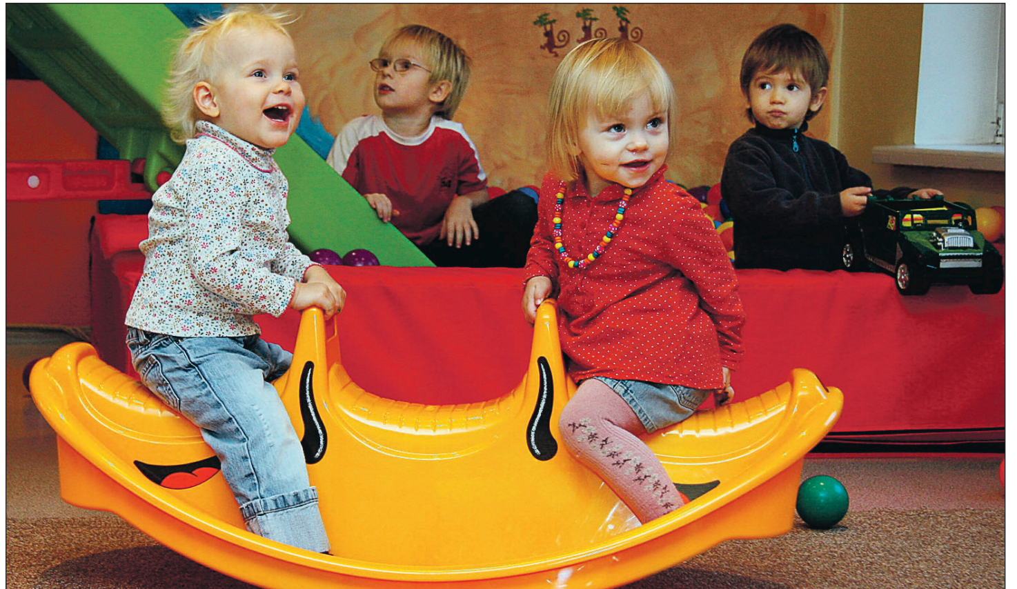
Põnnila mängumaa leiavad tegevust nii väiksemad kui suuremad lapsed.

Teiseks oli mul võib-olla alateadlik soov tagasi tõmbuda loominguiliste inimeste seltskonda, kes on mulle lähedased.