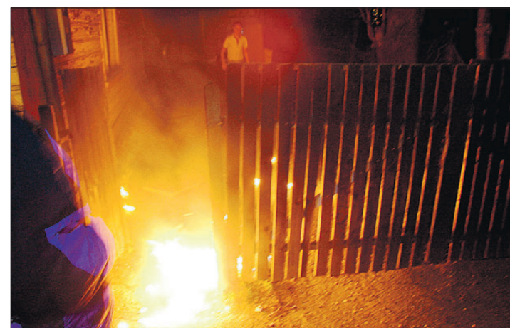
Õine sündmus äratas unised majaelanikud.

Et juhtumi kohta politseile avaldust esitatud ei ole, pole poli-tseile uurimist alustanud.