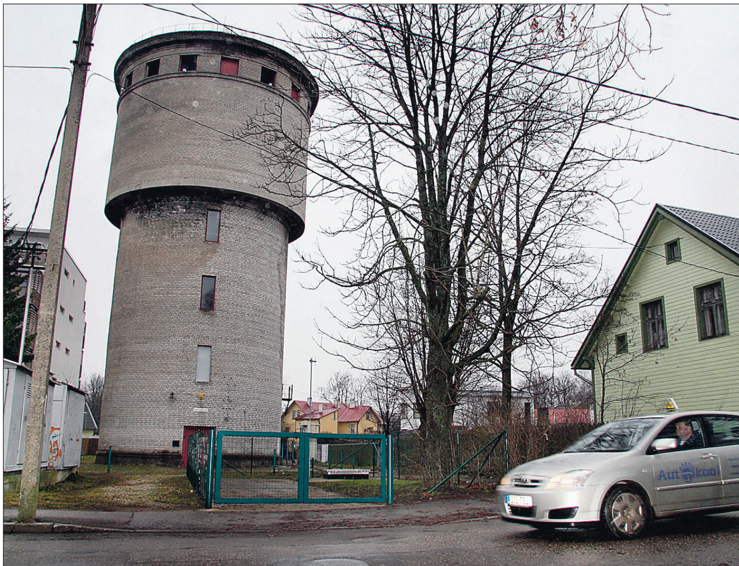
Ümberkaudsete majade elanikud ei soovi Suur-Sepa 13a kinnistule korterelamut.