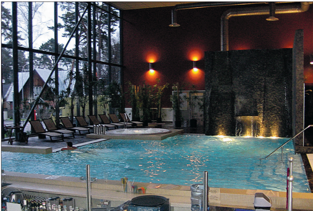
Hotell Jurmala SPA on soodne võimalus talviseks Jurmalas peatumiseks.

Interneti-aadressidel www.jurmala.lv ja www.hotelljurmala.com võib igapäevselt tutvuda võimalustega, mida lõunanaabrite kuurortlinnas teha. Seda eesti keeles, sest erinevalt Pärnu linnavalitsusest on Jurmala linn oma koduleheküljel