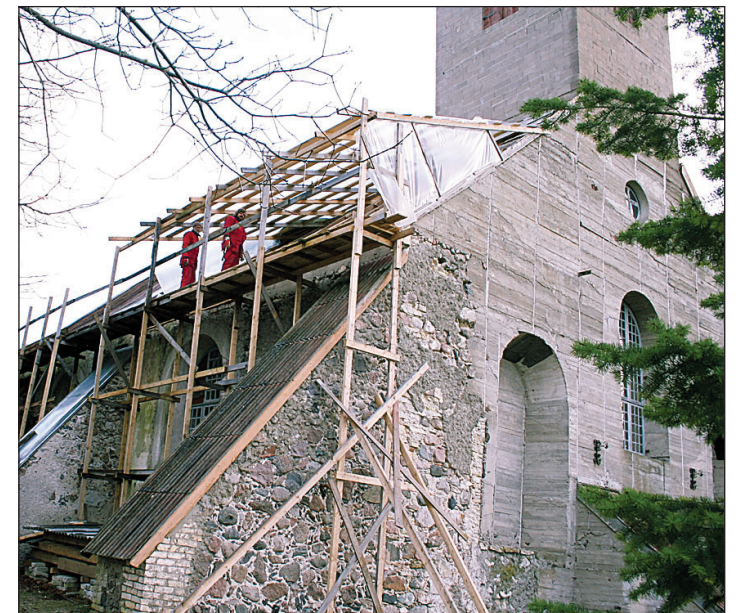
Tõstamaa kiriku katust ehitavad Tallinna töömehed. Henn Soodla

“Mõni aasta tagasi oli võimalus kirikule tornikiiver peale panna ja vallavalitsus oli valmis ettevõtmist toetama, kuid kogudus otsustas siis oma vahendid mujale kulutada,” teavitas Rõhu. “Nüüd on kogudusel huvi, koostöös tellime kiivri projekti ja alustame torni ehituseks raha otsimist.”