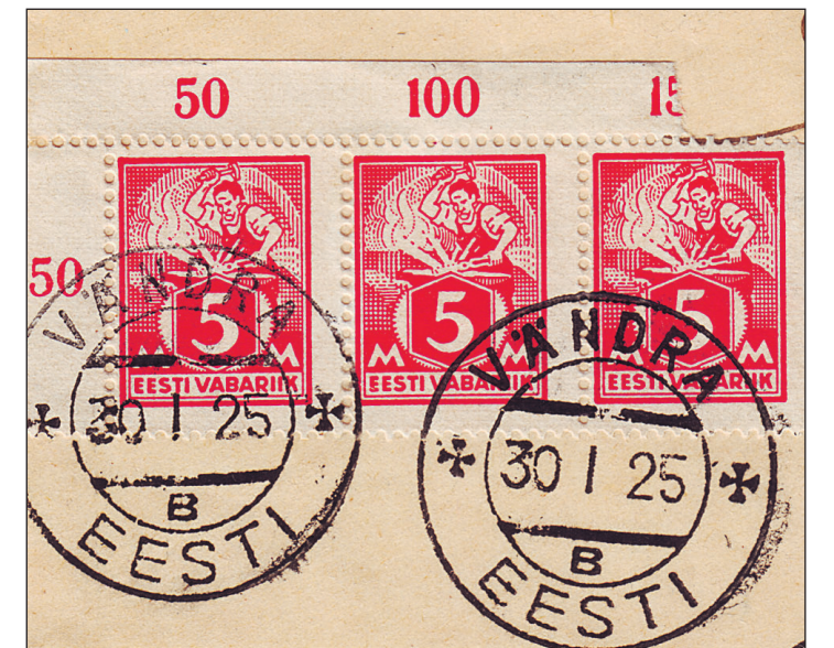
Vändra postkontori märketa "EESTI" postitempel 30. I 25.