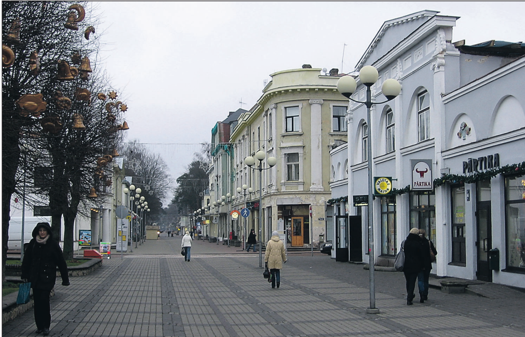
Jurmalas elab 55 400 inimest, neist pool käib Riias tööl.