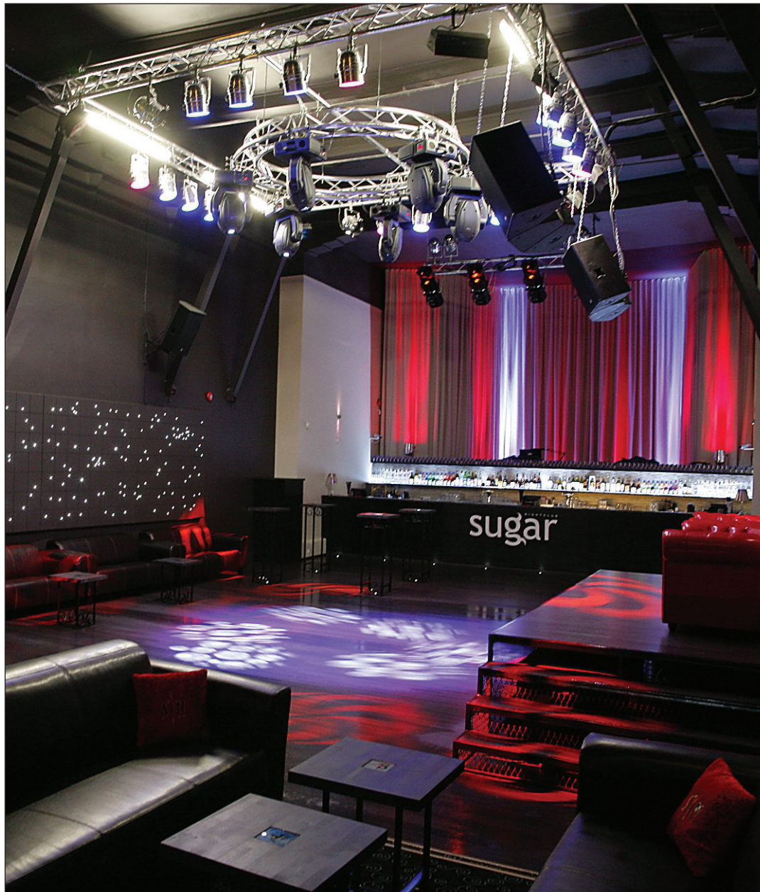
Kunagise kino Kiir hoones Vee IO avatakse reedel ööklubi Sugar.

Peale selle, et selles päikesele avatud istumiskohas saab kohvi juua, kavandatakse sinna ka esinemisvõimalust muusikutele.