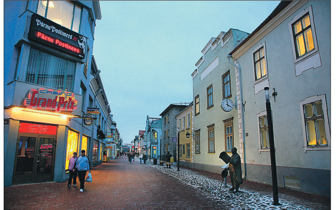
Ligikaudu 44 000 elanikuga Pärnu on iseseisev linn.