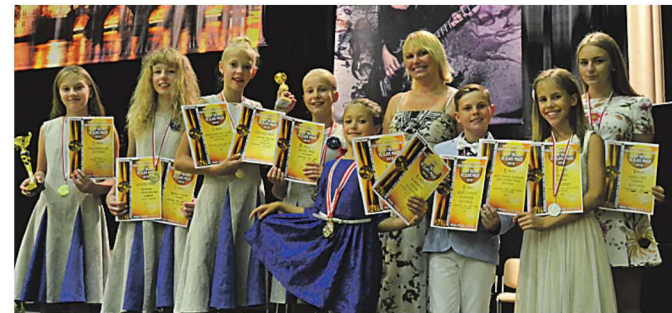
■ Noored talendid noppisid hulgaliselt preemiaid.

Ermi jutu järgi said õpilased eelkõige suurepärase esinemiskogemuse, näha ja kuulda teiste riikide noori andekaid muusikuid ja võrrelda oma taset teiste konkursil osalenutega. (PP)