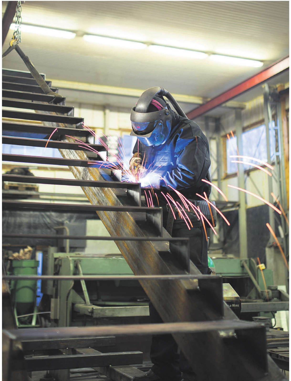
■ Ogeli metallitööstuse töötajatel on kaitseprillid ja tulekindlast kangast riided.