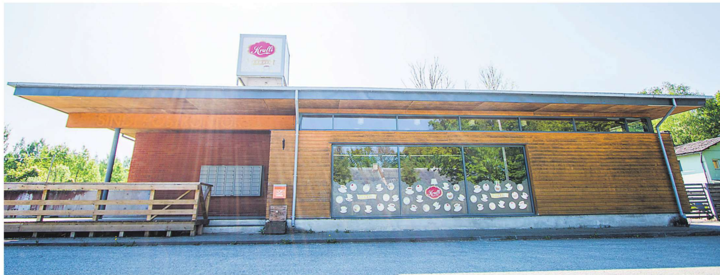
■ Aastal 2002 valminud postkontorihoonet suleti kümme aastat pärast valmimist, ajutise lahendusena leiti rentnikuks kohvikupidaja, kuid nüüd on osapoolte suhted inetuks kiskunud. Mailiis Ollino