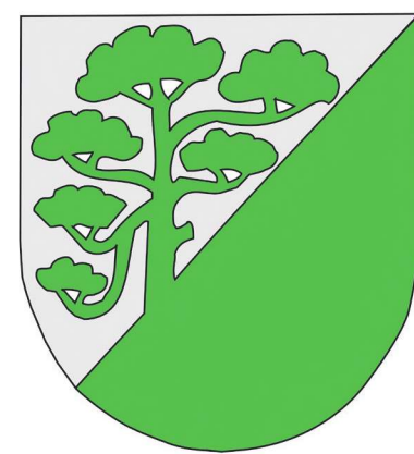
Raasiku valla vapp.

sada pole. Lipu osas küll. Raasiku valla lipp on heraldiline vapilipp, lehviv vapp, kus „kilbiks“ on lipukangas, mille jaotus ja kujundid on samad, mis vapikilbil. Selle erisusega, et hõbedat esitatakse lipul asendusvärvuse valgega (kulda vastavalt kollasega). Vapilipp on juba keskajast tuntud ja laialtkasutatav liputüüp. Nagu juba nimigi ütleb, tuleneb vapilipp otseselt mingist vapist. Vapilipu kangas on sama värvi, kui vastava vapi kilp ja kannab samu kujundeid – seega on ta sisuliselt lehviv vapp.