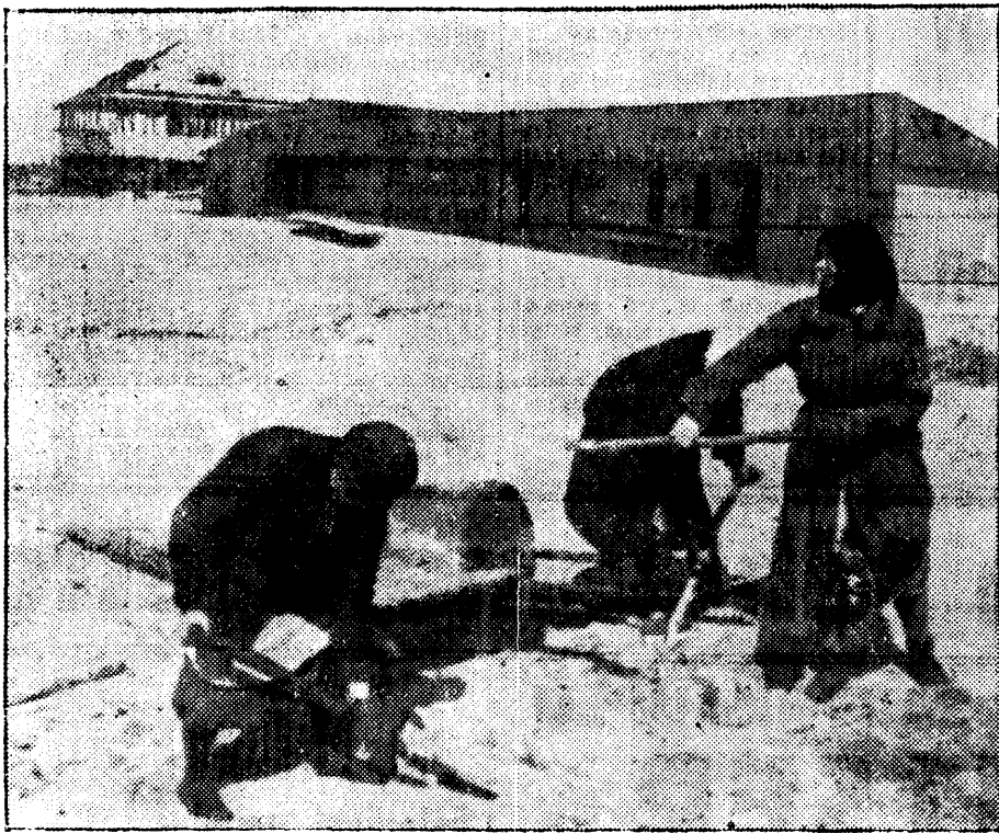
Epilaanil supelkabinid, taga ehitusel olev Pelguranna kohwilt; all — naised teevad rannale ilurawid.

„Eks siis paari nädala pärast kindlasti,“