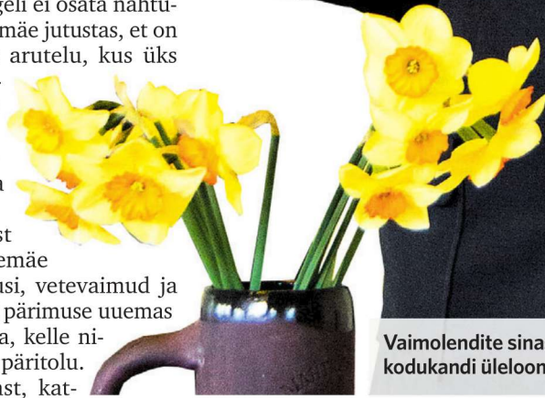
Vaimolendite sinasöber Mall Hiimäe teeb virulased tuttavaks kodukandi üleloomulike tegelastega. 3 X MEELIS MEILBAUM