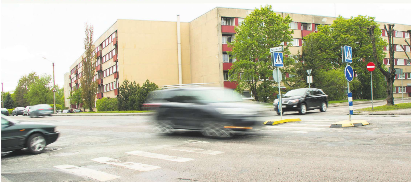
Võidu ja Tuleviku tänava ristumiskohta on kavandatud järjekordne ristmik. Tänavu seda siiski ehitama ei hakata.