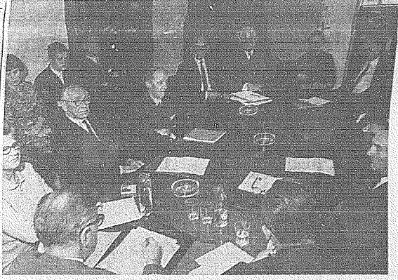
Gosvõidid EPL pooli korraldatud kongressil poliitiliste küsimuste arutamiseks ERS ruumides.