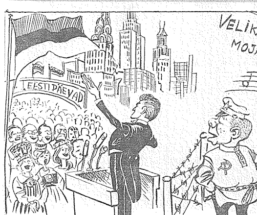
Eesti Päevaleht vahab maailmas on rahulolematuid peoliteatritajaid raudkardina taga...