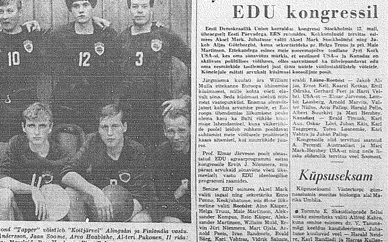
Lidulihasti võrkpallimeeskond "Tapper" vöistlik "Kõitjarve" Alingast ja Finlandia vastu.