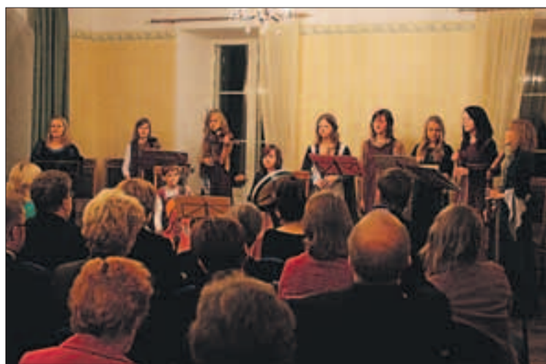
Kiili vanamuusikaansambli plaadi esitluskontsert Sausti mõisas.