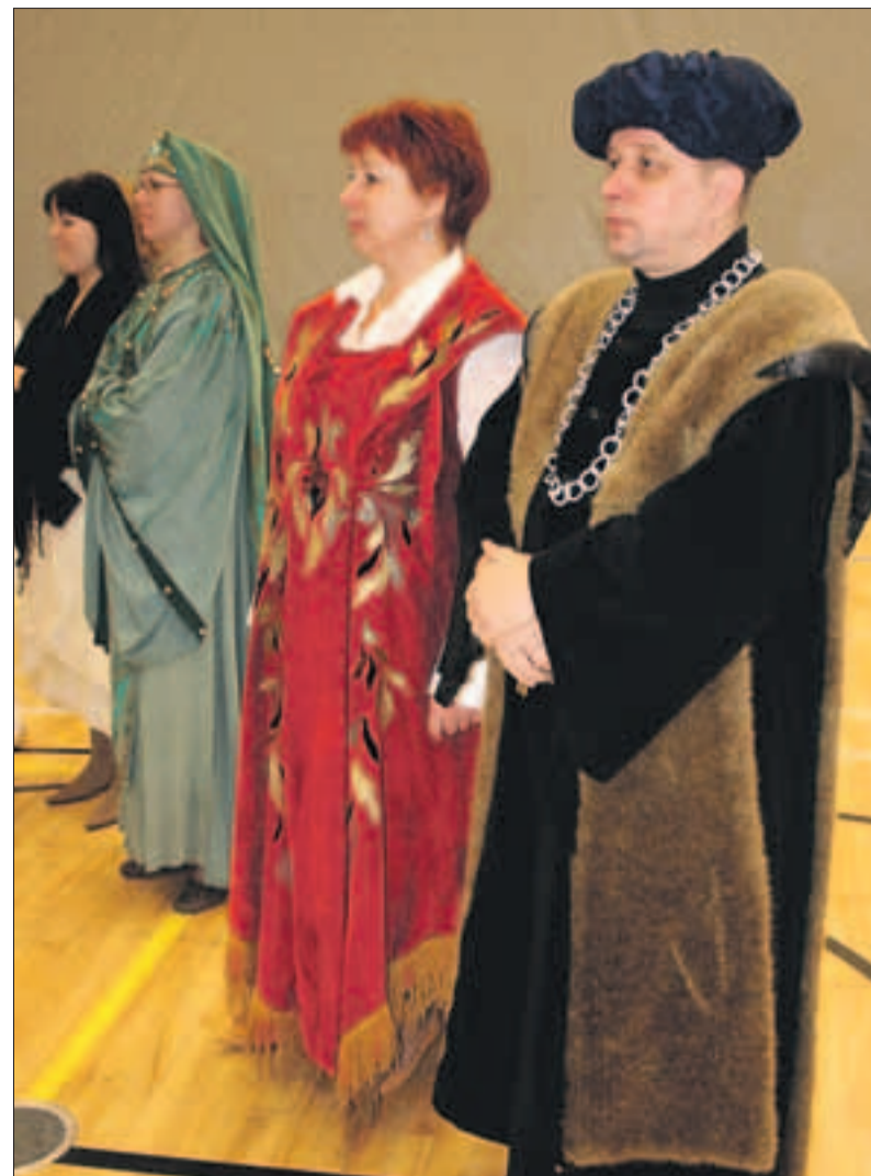
Gümnaasiumi keskajapäeval riietus koolipere ajastule vastavalt ning meenutas toonaseid elukombeid.

Tulevastele rüütliprouadele olid tagasihoidlikumad täringumängud, nooleviskamine ja muudki. Lisaks kuulati vanamuusikaansambli, tant-siti ajastukohaseid tantse ja vaadati