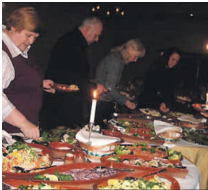
Kiili ettevõtjate liidu sünnipäev Rae vallas asuvas restoranis Üksik Rüütel.

Põhikirjajärgselt valib KEL iga aastal uue juhatuse ja on võtnud põhikirjas mitmeid eesmärke, millest üks ka klubilise tegevuse edendamine – ettevõtjate ja valla juhtide omavahelise suhtlemise parandamine jne.