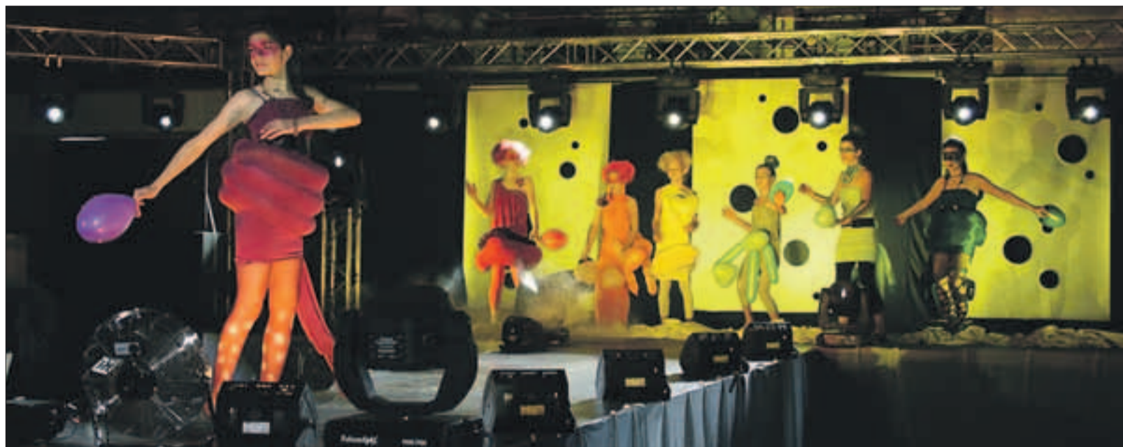
Hästi korraldatud moeshow ning järgnev pidu on teist aastat olnud elanikupäeval noore publiku magnet.

Kell kolm spordihallis ametlikult avatud üritus jätkus valla aktivistide tunnustamisega, mustkunstniku esi-