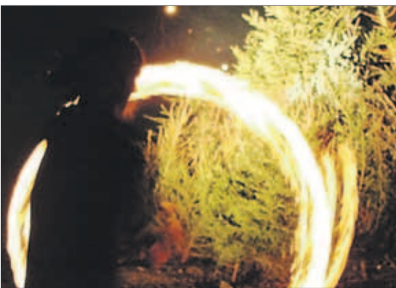
Tulepeo kulminatsiooniks oli kuuskede põletamine.

Tema sõnul võtsid paljud inimesed üleskutsest vedu ja lõkkepaika tekkis mitmekümnest kuusest suur kuhi. 6. jaanuaril toimunud jõuluaia ärasaatmist ning lõppemist tähistavale tulepeole tuldi kogu perega. Esinesid rahvamaja liikumise- rühm spetsiaalselt ürituseks ettevalmistatud kavaga, tuležonglööri ja torupillimängija. Pidulikkorraldati ees-