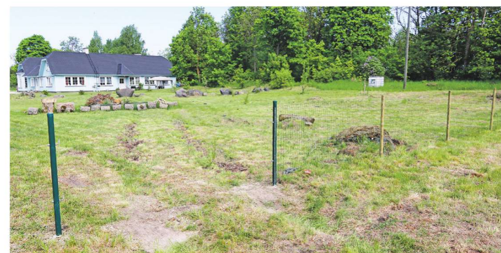
Aiapostid, võrk ja väravad said püsti möödunud nädalal vabatahtlike jõul.