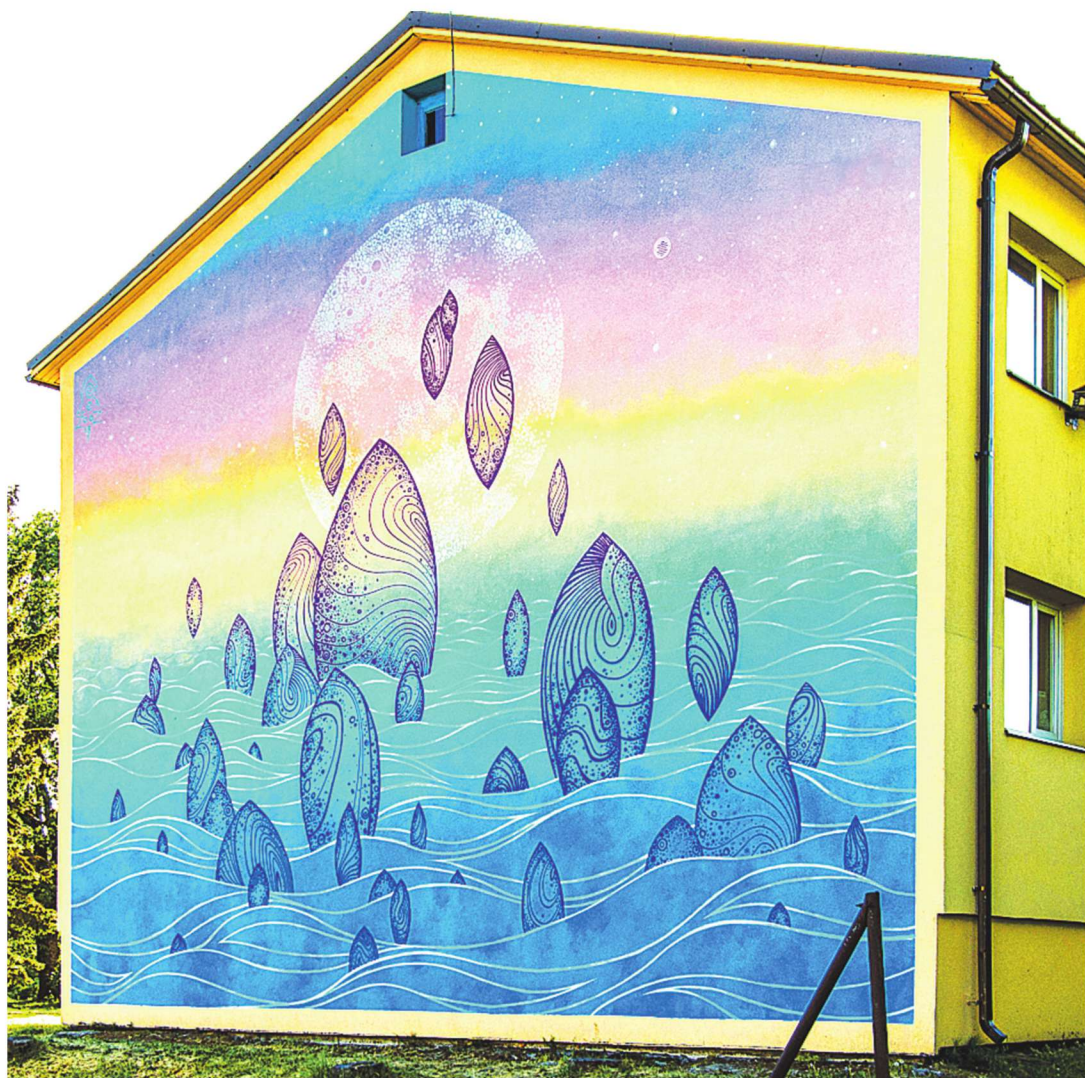
Seinamaaling „Vaala unistus” peaks vastu pidama vähemalt 25 aastat.

Lihula maalingu on kunstnik nimetanud „Vaala unistuseks” –