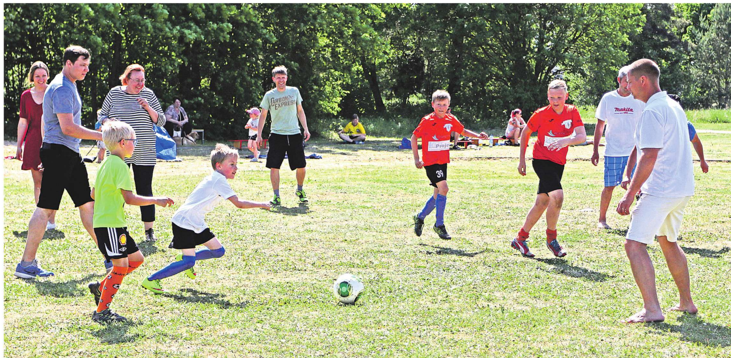
Lastekaitsepäeva jalgpalliturniiril läksid palliplatsil vastakuti ka lapsed ja lapsevanemad.