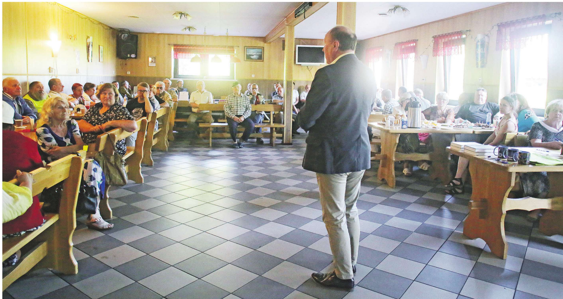
Riigikogu liikme, Suure-Lähtru mõisa omaniku Mart Helme kuulajad haarasid Lihula Särtsu kõrtsis peaaegu kõik pingid.