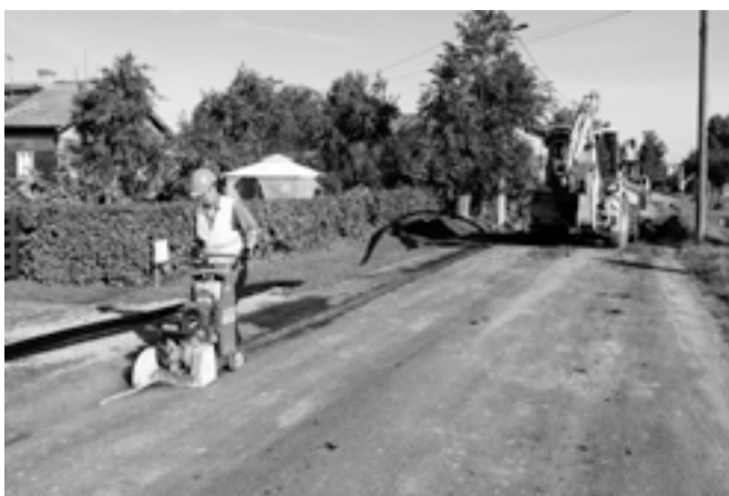
Pärnu tänava vee- ja kanalisatsioonitrassi ehitustööd Mõisakülas tänava septembris.

Vastavalt „Mõisaküla linna ühisveevärgi ja -kanalisatsiooni arendamise kavale 2008–2019“ valmiski tänava oktoobrikuus esimese etapina Pärnu tänava vee- ja kanalisatsiooni trass. 660-meetrise trassi rajas Sooja-tehnik OÜ. Põhiosa rahast 153 405,72 € ulatuses sai linn ehituseks Keskkonnainvesteeringute