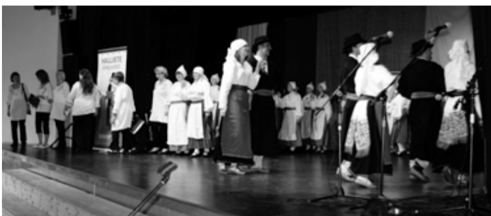
Esinemiste otsa kihelkondade päeval Karksi-Nuias tegi lahti Halliste kihelkond.

Igas „jaamas“ lisandus „peorongi“ uusi rõõmsaid rahvariites esinejaid: Mõisakülast tantsurühma Ütenkuun ja Abjast Wallatute nobejalgseid noorikud, Halliste mailt Särtsu ja Tureli tantsijad, Sõsare tantsumemmed ja ansambli Rosin laulunaised. Kultuurikeskuse lavalaudadelt esitati finaali-