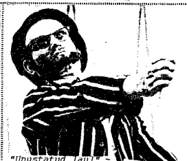
"Unustatud laul" Kunstnik - A. Pik