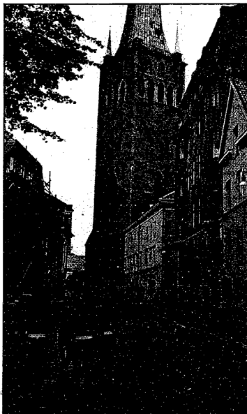
Tänapäeva Tallinn: vene sõjaväepatrull Oleviste kiriku juures

Jaapan on häiritud N. Liidu sõjaliste jõudude suurendamisest tema otsestel läheduses. Kurioosumiks selte juures on, et jaapanlased ise on alandanud N. Liidu merejõudude suurenda da ja ehitised neile lennukite emalaeva "Minsk".