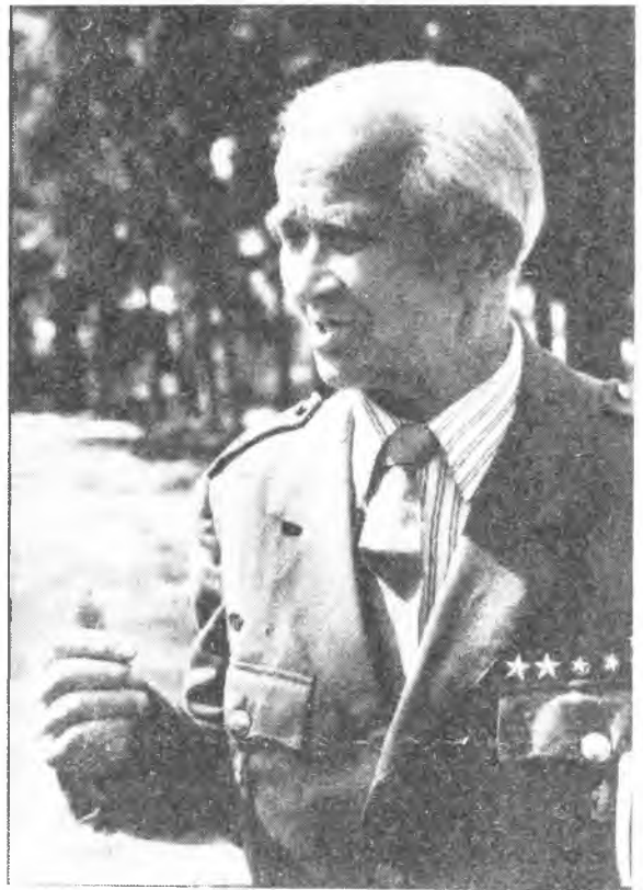
Laagri elulõkke juures aeti meestejutte.