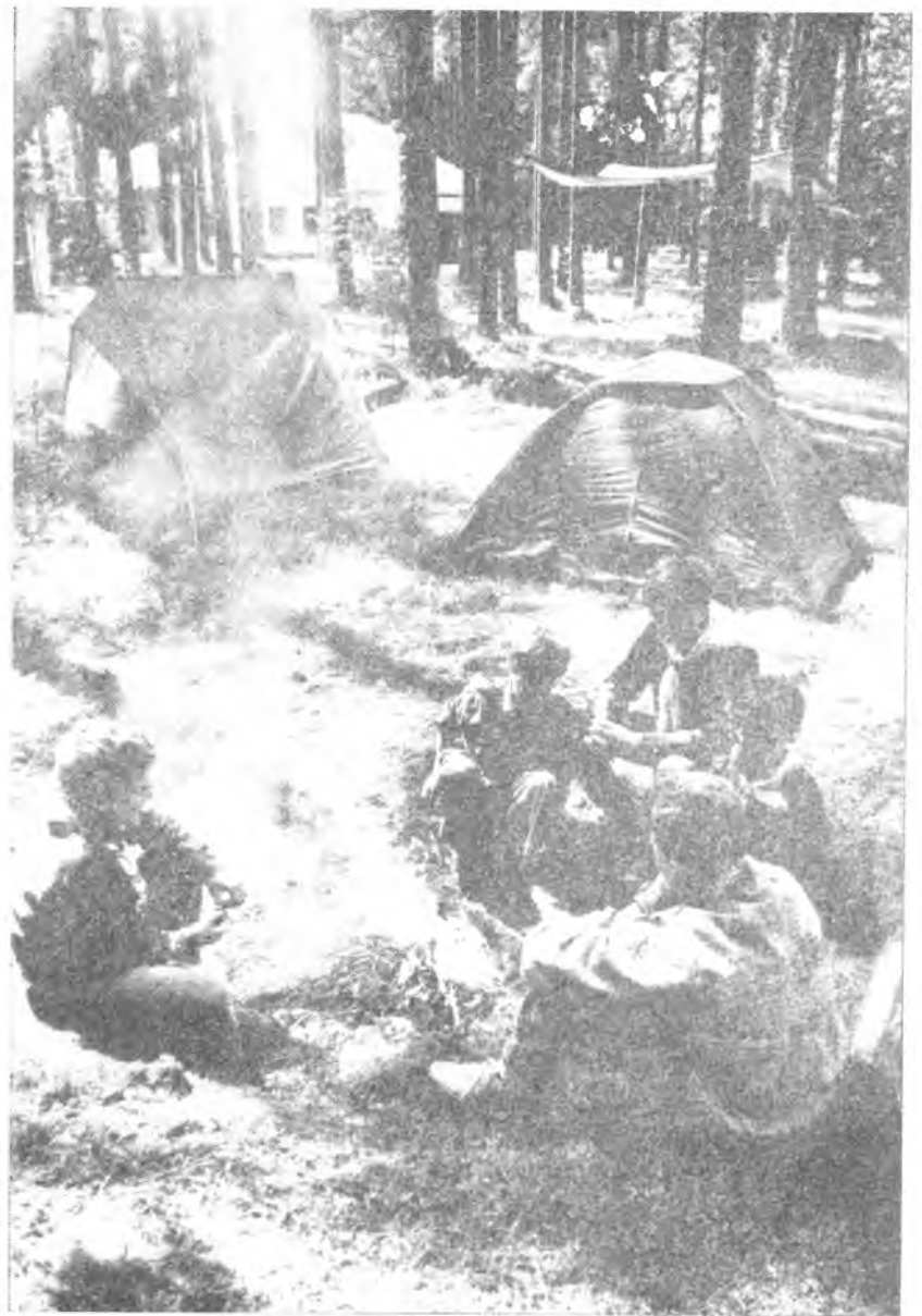
Laagri elulõkke juures aeti meestejutte.