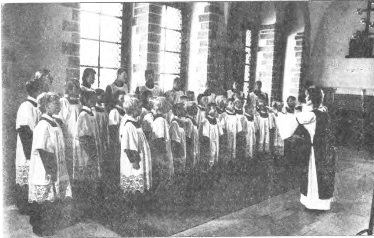
Vanalinna Poistekoor Tallinna Raekojas.