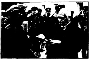
Küüdnarv saatis võidelnud kaitselised.