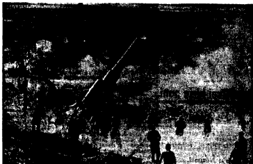
SARKEKAKUR TEGEVUSES. Kõhaldamad võitlused sakslaste ja prantslaste vahel peeti Alame'i jõe lähedal püüdes, õhul unksitend püüdes tegevusse rakendama kõik oma reitallid ja välja paanika kuuks jõe.