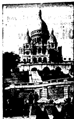
SACRE-COEUR, kuuks kirik Pariisis, mis oma kõrge asukohta ja valge kupli tõttu kangele silma paistab.