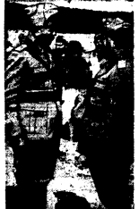
MARSSAL BADOGLIO, Mussolini staabi-õhku, annab õhukele vabale sõjaväelasele aruandest.