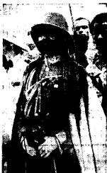
HAIJE SEIÄSSIF, end. Ameerika õhuke, oluvalt, nagu kättemõistud tahtlusest, Austriaheste sõltumise, et unesti sõjalaada võitlust Itaalia vastu.