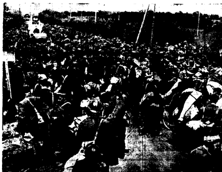
VÖITLUSSE LOFF, Prantslasega on võid võitnud maha paaned ja määratsetud red sõdurite hülgend on saltsaad sakslaste kätte vangid. Põhul — õhu vangitõttud Prantsuse sõdame.