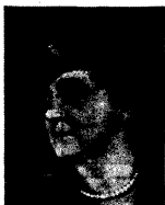
HELENA, Itaalia kuukspaana.