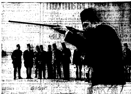
KUNINGAS LASKER MARKKI, Ka egiptlased on rekrutatsiooni rahvas, kes püüab läbielupaaga kätel sõja armeele väe-meret. Nõukogus annab egiptlane kuningas Faruk'ile, kes, nagu püüab maha, harjutab talitruua kättemõist.