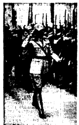
UMBERTO, Itaalia kroonprinssi, vastast loe ehit sõjaväelase minevat väeosa.