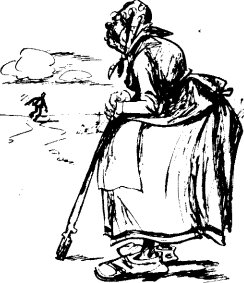
„Vasna andinudkna või jälle tulupuisedades kivistult. Kudust rauda null paari ohadusega mi karistada, e podet teovus jaoks.“