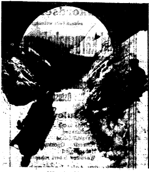
And on this page...