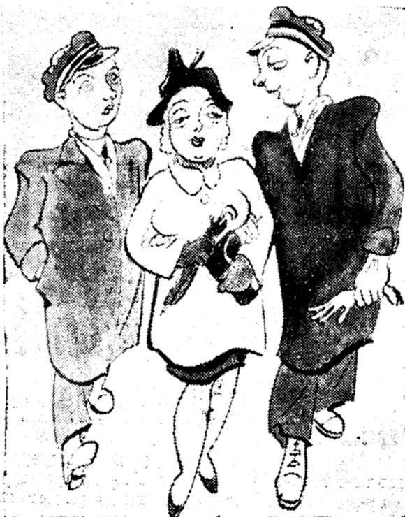
„Praegusel ajal ei ole sobiv tahta enesele hõberebaseid, — ka kuldrebastelega võib läbi ajada.“

lata, milleks mul veel tunda häbi oma rumaluse pärast, kui enam eladagi ei taha!