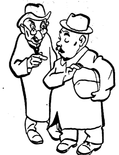
„... niisama,“ ütlesin, „sest, kuidas sa julged seletada, et ostsid tagavaraks kärbspaberit.“

Aga tuttav ei jäta. Aina pinnib ja pinnib, et mida ostsid. Arvab ja arvab, aga õigele otsale ei saa. Loeb pekki ja võid, nahku ja petrooleumi, suhkrut, ja soola, aga õigele otsale ei tule. Lõpuks tüdinesin teise raskest pealekäimisest ja avakasin talle tõe. Milleks veel sa-