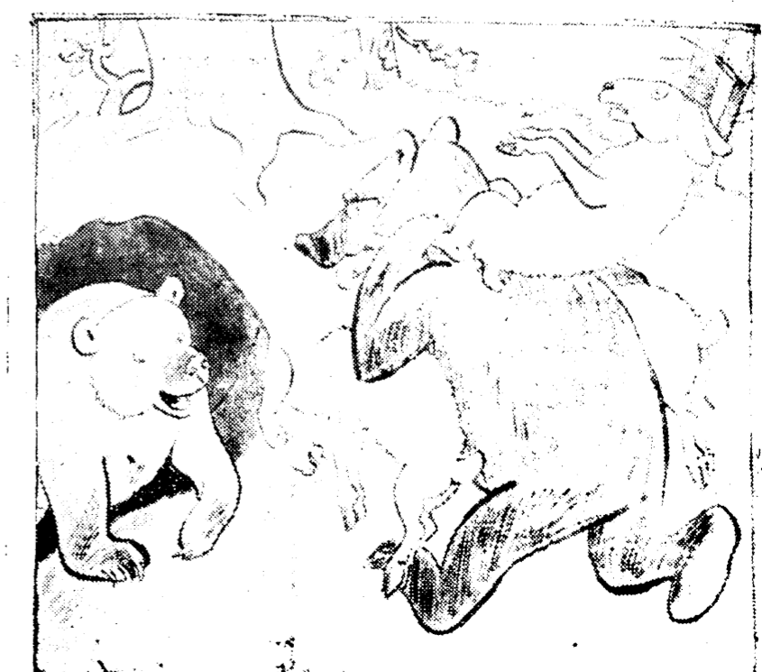
„Mida kannad sa seal nii usinasti, karupapa?“

Karud on viimasel ajal teinud lam- balautades ränka hävitustööd.