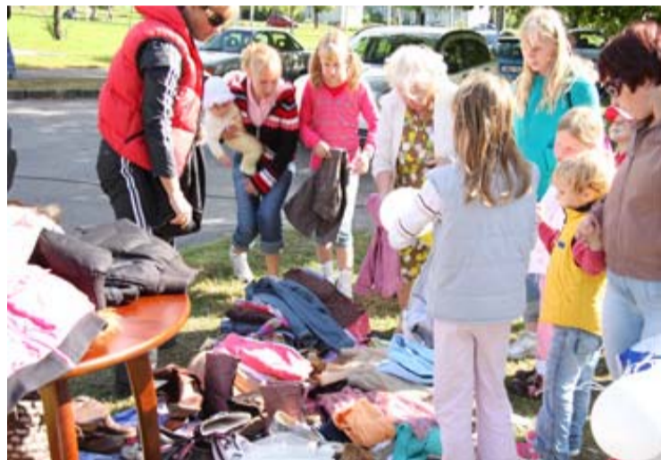
Vanakraamiturul käis elav kauplemine