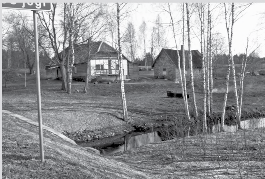
▲ Kodust kirjutatakse ja luuletatakse, sealt minnakse välja ja sinna tullakse jälle tagasi – õnneliku(ma)d ja vaba(ma)d on need, kellel on oma kodu.

Perekonda kuulumise hüved kaaluvad kõrgelt üles piirangud, mida perekond üksikisiku vabadusele seab.