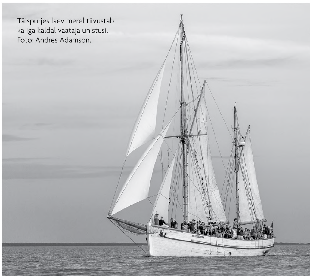
Täispurjes laev merel tiivustab ka iga kaldal vaataja unistusi.