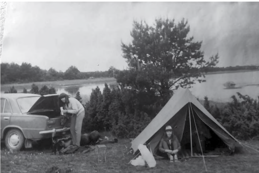
▲ Auto ja telgiga sai ikka reisil käidud, pilt tehtud Hiiumaal.