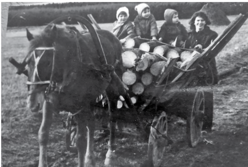
▲ Minu helgeim lapsepõlvemälestus on isa kodust - Lõuna-Eestist.

ning seeläbi tunnistuseks, mis läheb jagamisele laiema lugejaskonnaga, ning arvab, et parem oleks, kui me jutu pooleli jätaks ja ma ikkagi kedagi teist otsiks.