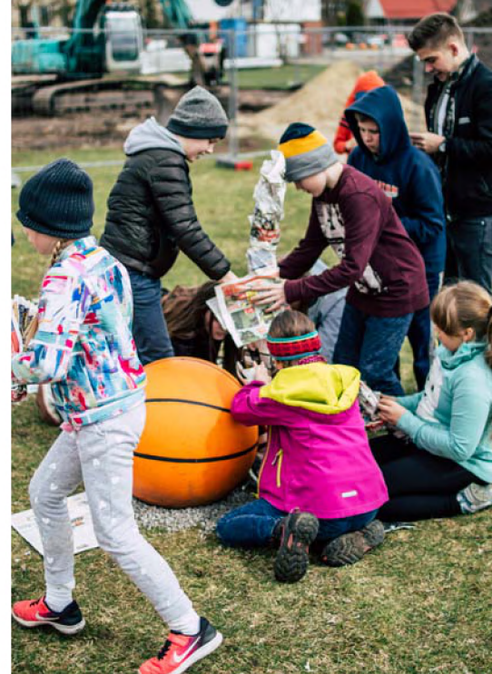
▲ Maastikumängus sai ajalehetorni ehitamisele lisaks ka sõprussildu sõlmida.