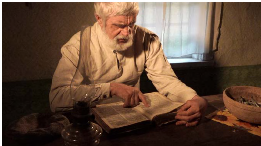
▲ Kaader dokumentaalfilmist toob esile, kuidas pikkadel öhtutundidel Piiblit uurides usuvabadusele ärgati.