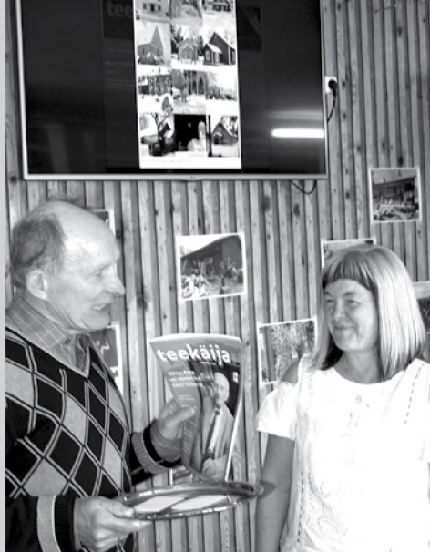
Vaimulike töötajate kevadisel õppepäeval 12. mail Nuutsakul loositi välja seekordsed Eestimaa kirikute tundjad.