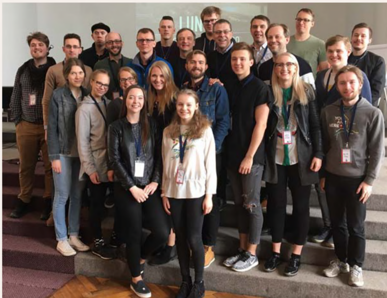
▲ Enamus EKB Liidu konverentsilistest tulid Riiga 3D kogudusest, olles nii ise tunnistuseks koguduserajamise õnnistusest.

Koostöös Euroopa Baptistiföderatsiooni ja Converge baptistiliiduga USA-st toimus 19.–21. aprillil Põhjala ja Baltikumi koguduserajajate konverents Riias, millel osalesid suurearvuliselt ka EKB Liidu esindajad.