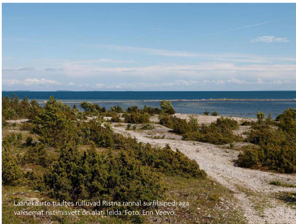
Läänekaarte tuultes rulluvad Ristna rannal surfilained, aga vaiksemat ristimisvett on alati leida.

Hiiumaal on suurepärase olla koos perega. Tule meiega koos ühist lugu kuulama ja jutustama! ■