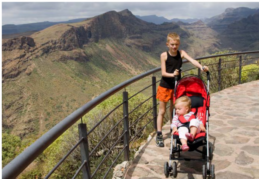
▲ Lastega perereisil Tenerifel, 2006. aastal

„Õnnelik on inimene, kes on liiga hõivatud, et muretseda päeval, ja liiga unine, et muretseda öösel.”