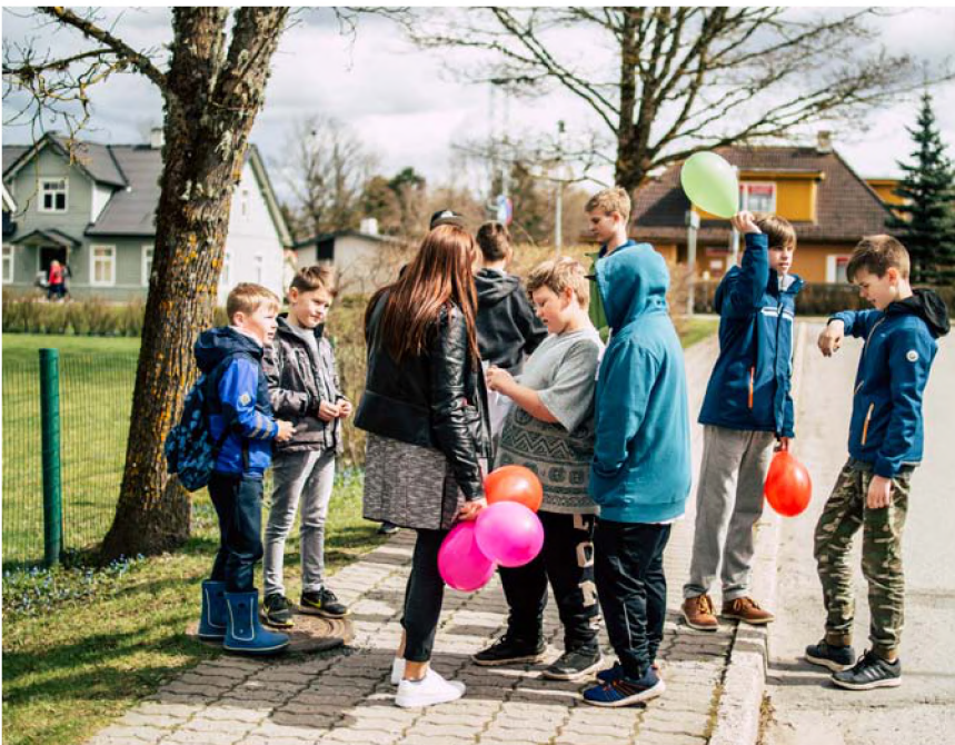
▲ Kontrollpunktide vahel toimus fotojaht, mis aitas noortel koostööd arendada.