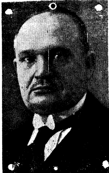
Riigivanem K. Päts.