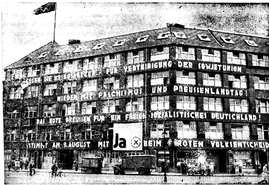
RAHVAAALETUSEELSEID KIHUTUSPLAKATE BERLIINI TÄNAVAIL.

wa-Tallinna maanteed. Purtse kitta juures ta jõudis järgi jalgratturile. Dehn andis märgusignaali. Sõitja, kes oli näilijelt purjus, püüdis juhtida ratast tee äärde. Tõikti kohale jõudes, kaotas rattur tajafuulu ja kukkus tükli alla.