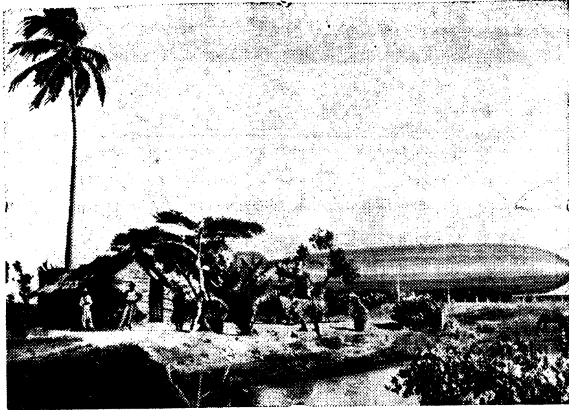
„Graf Zeppelin“ reordisidit Lõuna-Ameerikas.

Pärast püsti üle 60 tunni kestnud lennu maandus „Graf Zeppelin“ õnnelikult Pernambuco, püstitades selle oma tänawu teistkorde Lõuna-Ameerika len-