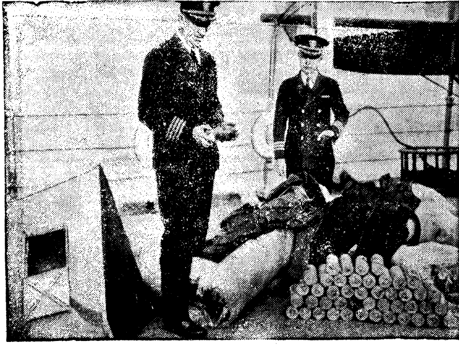
Mis jäi järele maailma suurimast õhulaevast.

Bilidil mitmelugust kriibu-trabu, mis nüüd Ameerika hiigla-õhulaeva „Arconi“ hukkumispäeva lähedusest leiti: laadimajalese ofsi, süütematerjali ja mitmeluguseid riidehilpe.