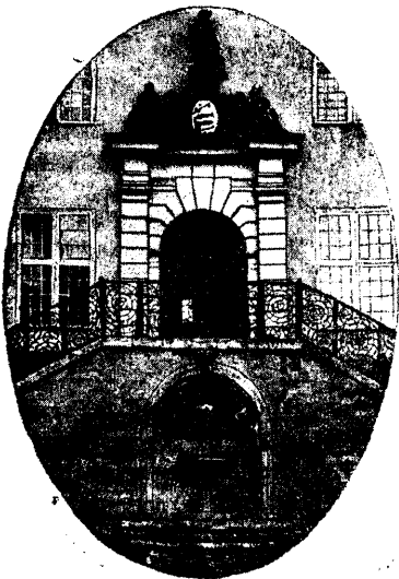
Sissekäik raekolla. Ükses seis alali laskevalmis kuulipilduja

levad ilma kohtu koha peal maha lasta. Nüüd wabastati minu vend ja lasti teda minna. Mind aga toodi välja, pandi seina äärde, 5—6 püssimeest walvaks juurde ja hakati kuulipildujat minu sihis üles seadma. Ülesid, et teevad veidi laskehurutust walge kuradi nahal. Pöörasin silmad seina