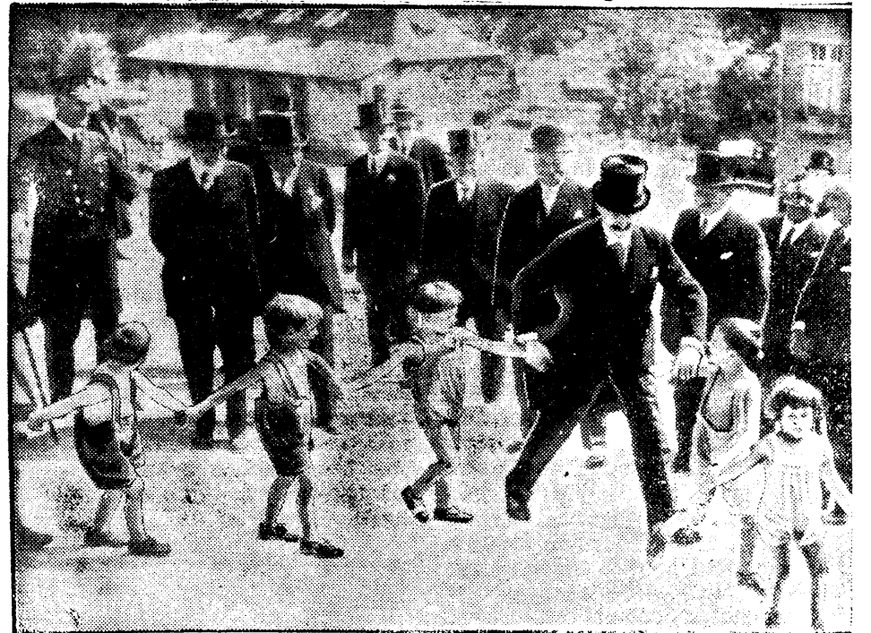
Prantsuse president Lebrun, kiltastades üht kila ja nähes lapsi mängimas, ei suutnud säilitada „diplomaatlikku külmust“ ja astus laste hulka mängima ringmängu.

näha, näitab tööliserakonna häälte arw suurt juurekaswu. Kodanlike erakondade allunemise tõttu on wõimalik, et tööliserakond tuleb wõitjaks.