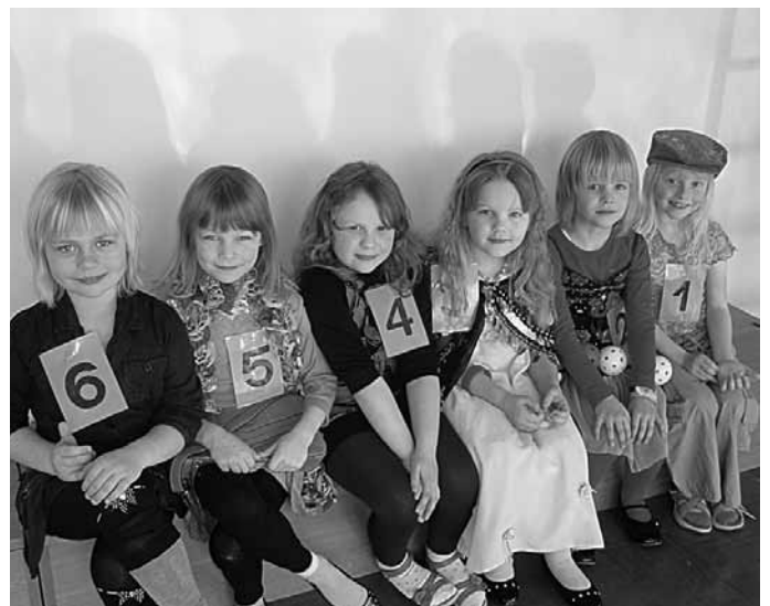
Tüdrukud ootamas oma etteaste moedemonstratsioonil