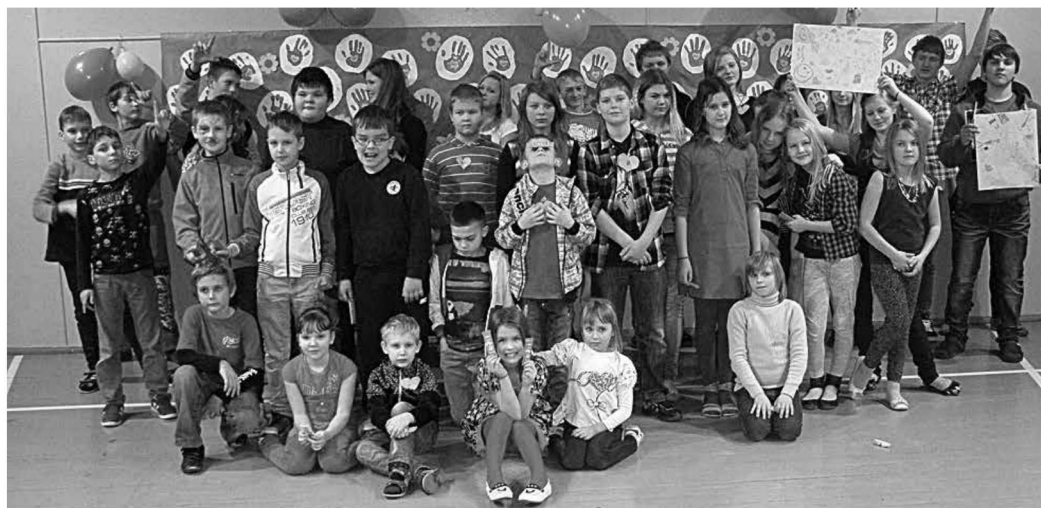
Sõbrapäev Ambla Lasteaed-Põhikoolis.

„Sõbrapäevanädalal (täpsemalt 13.vebruaril) toimus koolis palju üritusi, sealhulgas ka õpilastele mõeldud karjäärinõustamine. Meiega tegelesid kaks rõõmsa naeratusena noorootõotajat, kellega mängisime huvitavaid mängu ja lahendasime ülesandeid. Klassis istusime kõik suure ringis – pidime end tutvustama ja rääkima ühest asjast, mida täna õppisime. Edasi pidime kirja panema tegevusi, mis meile rõõmu teevad. Neile tuginedes pidime rühmatööna looma unikaalse tegevusalaga firma. Meie rühma idee oli tiibelamu s.t. tiibadega elamu, sest kõige rõõmsamaks teevad inimese pere, sõbrad ja reisimine. Ja miks mitte neid siis ühendada? Meie firmas saaksid huvilised rentida/osta eralennuki koos piloodiga. Seal oleks võimalik elada ja