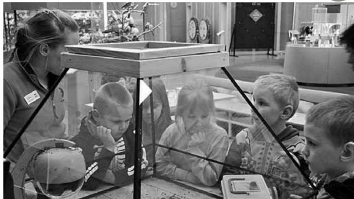
Lapsed uurivad sipelgaid.