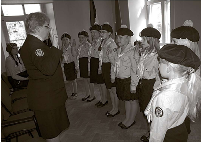
Töotuse andmine.