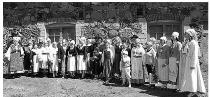
Rahvakultuurikeskuse Jänedal rahvariie valmistamise kooli lõpetajate grupp ja Tallinna MTÜ Rahvarõivas poolt korraldatud kursuse „Minu rahvarõivas – särgist sõbani“ lõpetajate grupp.