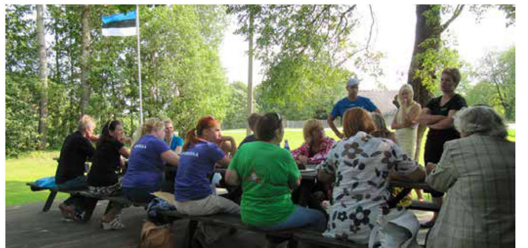
Ühine arutelu Roosna külaplatsil