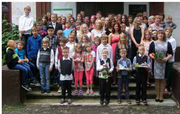
Ambla Lasteaed-Põhikooli koolipere 1. septembril

HEAD UUT ÕPPEAASTA ALGUST! • ARAVETE LASTEAED MESIMUMM SAI 35! • KAS SINUL ON JUBA KORSTNAPÜHKIJA KÄINUD? • NÄITERING ANNE PÄLVIS TUNNUSTUSE • AMBLA VALD VÕORUSTAS MAAPÄEVA DELEGATSIOONI • NOORTEKESKUSTE UUS HOOAEG • SPORDIINFO • TEATED JA REKLAAM