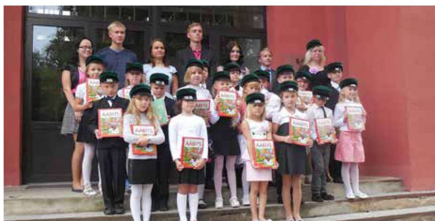
Aravete Keskkooli 1. klass koos klassijuhataja ja abiturientidega.