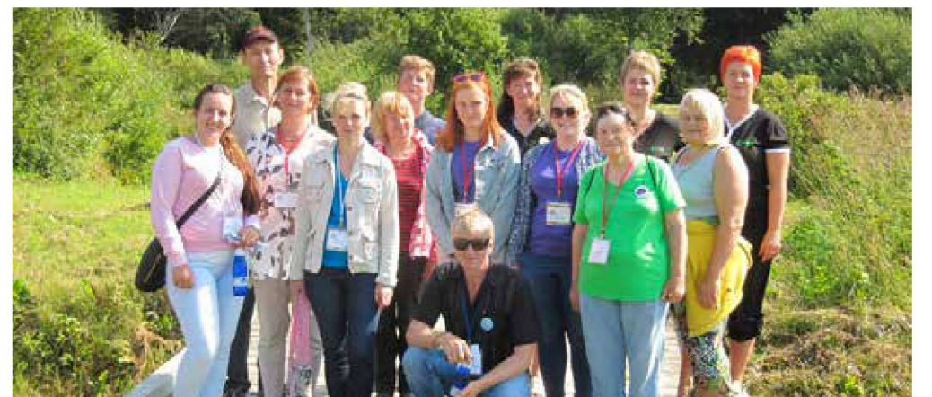
Uustalu pärandkultuuri õpperajal, Tammiku vesiveski koht