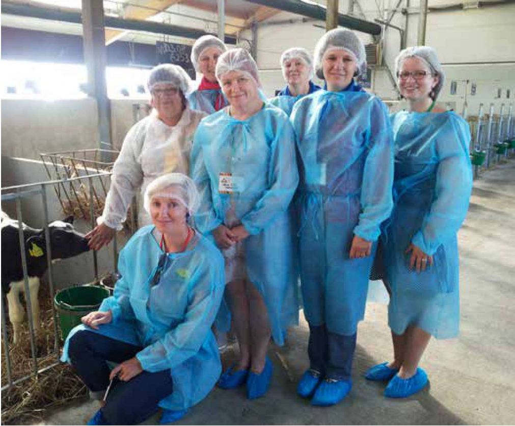
Aravete ideegrupp Mägise suurfarmis.

“Kuulakem, külad kõnelevad” oli selle aastase Eesti külade XI Maapäeva teema. 7.-9. augustil oli Järvamaa võõrustajaks liikumise Kodukant suursünnimusele, millest sai osa ka Ambla vald. Kahel päeval külastasid meie valda külalised üle Eesti ning ka välismaalt. Iga kahe aasta tagant toimuva maapäeva eesmärgiks on koondada oma liikmed, maakondade külade esindajad ja koostööpartnerid ühistesse mõttetalgutesse maaelu arendamise teemal.