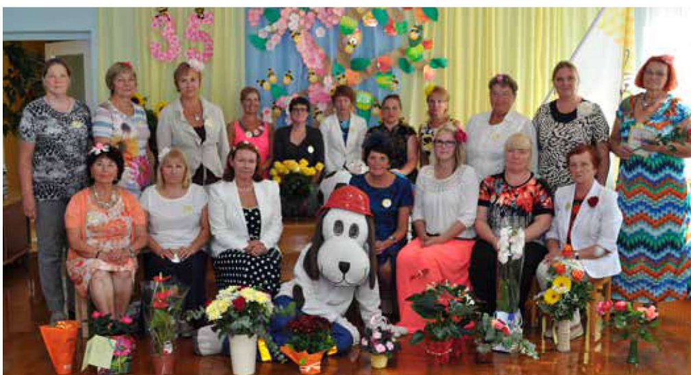
Mesimummi pere sünnipäevapeol koos Nubluga

Meie kõige tähtsamatele ehk lastele toimus koo-