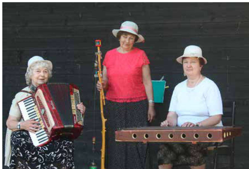
Esku trilleri külakapell.