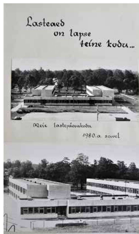
Väljavõte esimesest lasteaia kroonikast, esimene lehekülj