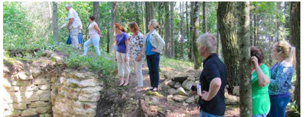
Roosna küla ideeretkest osavõtjad Ussimäe kultuurihoialal taastatud lubjaahju juures