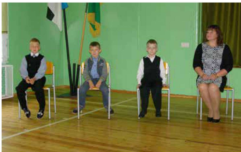
Ambla Lasteaed-Põhikooli 1. klass koos klassijuhatajaga.