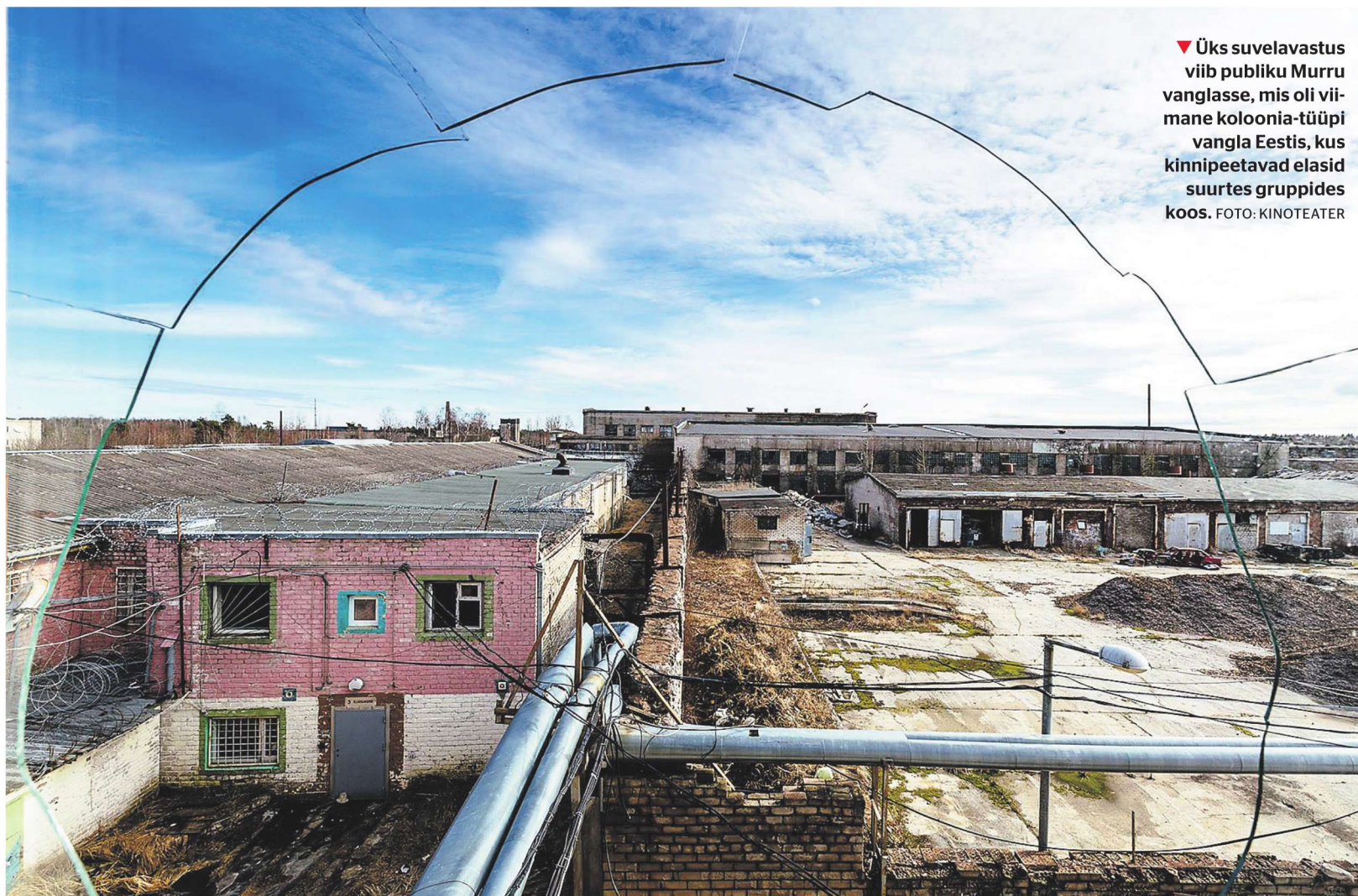
▼ Üks suvelavastus viib publiku Murru vanglasse, mis oli viimane koloonia-tüüpi vangla Eestis, kus kinnipeetavad elavad suurtes gruppides koos.

Suvelavastuste kirjeldused on seekord erakordselt müstilised, veidi süngemate alatoonidega ning omapäraste kiiksudega.