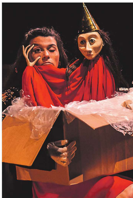
▲ Inimesed on pakendid, just nagu kastid.