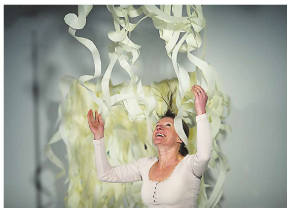
▲ Muusikast ja volditud paberist sündis lavastus "Oih!".