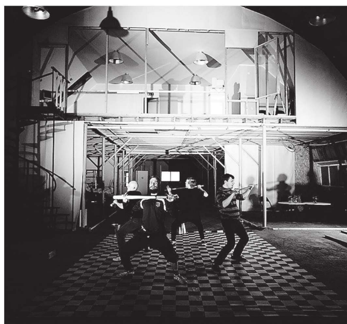
▲ Hetk lavastuse "Kellavärgiga apelsin" proovist.