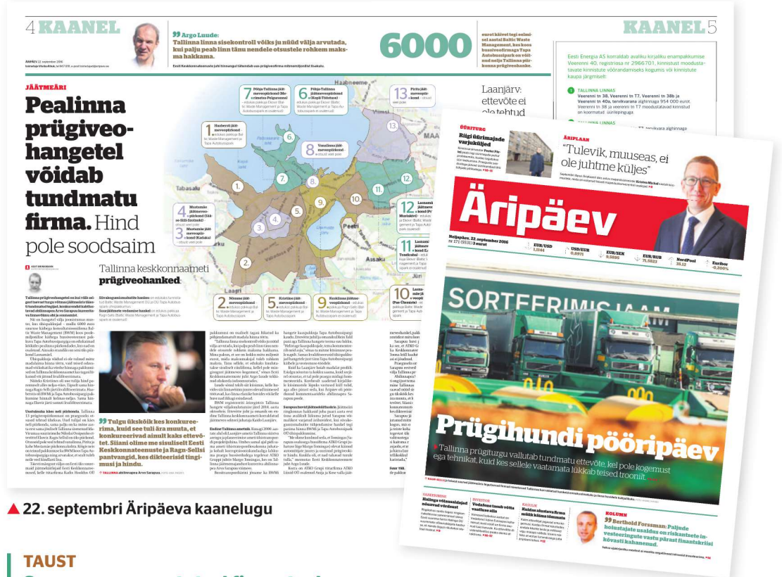
▲ 22. septembri Äripäeva kaanelugu