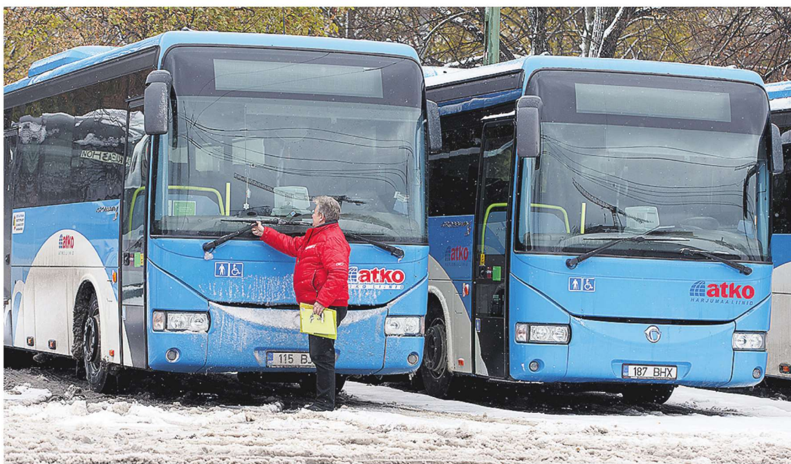
▲ ATKO Liinide bussivedudega on sel aastal vähem probleeme olnud.

ATKO Liinid esitas aga Harju maakohutusse ühistranspordikeskuse vastu hagi ligi 41 000 euro suuruse võla ja viivise nõudega. Aprilli lõpul kinnitas maakohus poolte vahel sõlmitud kohtuvälise kompromissi, mille järgi kohustus ühistranspordikeskus