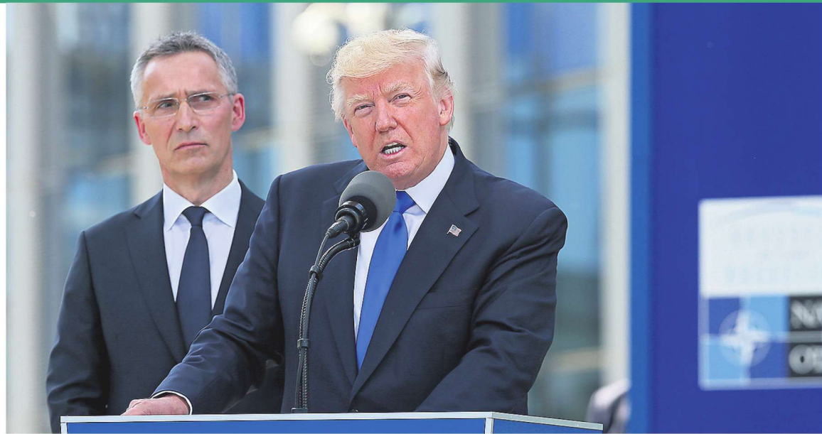
◀ NATO peasekretär Jens Stoltenberg ja USA president Donald Trump eile Brüsselis.

"Oleme Eesti meedia vahendusel piinlikkustundega jälginud Eesti Telekom endiste väikeaktsionäride viimased seitse aastat kestnud kohtuteed, kus Euroopa üks suuremaid telekommunikatsiooniettevõtteid Telia Company AB keeldub tasumast õiglast hinda Eesti Telekomist välja tõrjutud 1563 väikeaktsionäri nende aktsiate eest ja rikub aktsionäride võrdse kohtlemise põhimõtet," kirjutab liit.