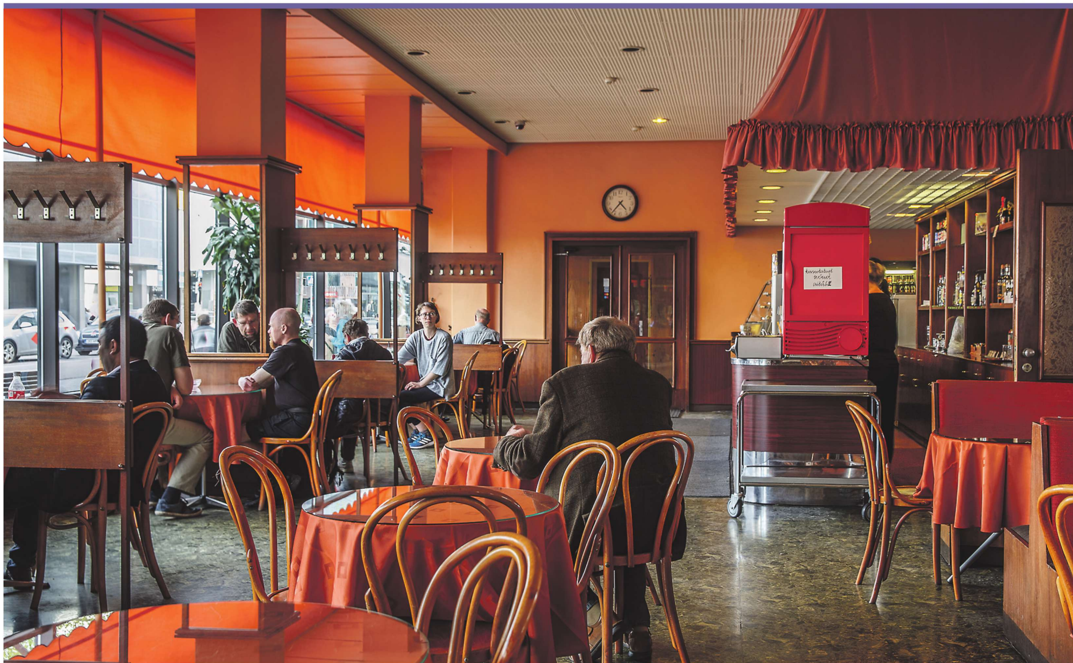
▲ Ajas muutumatuna püsinud kohvik Energia on justkui rahu kants keset tormakat ja muutlikku südalinnamelu.