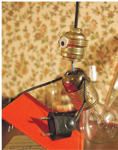
▲ Hr. Watt on kultuurihuvidega lambipirn.