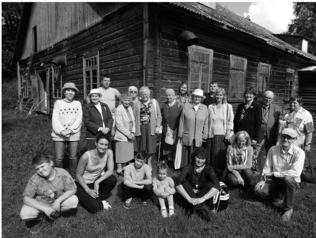
Külalised ja pererahvas Juuru palvemaja juures

Kokkuvõttes jäid osalejad väljasõiduga väga rahule ja olime tänulikud koosveedetud aja, uute teadmiste ja suurepärase vastuvõtu eest ning rõõmustasime, et Jumal kinkis meile ka suurepärase ilma ning kordamineku.