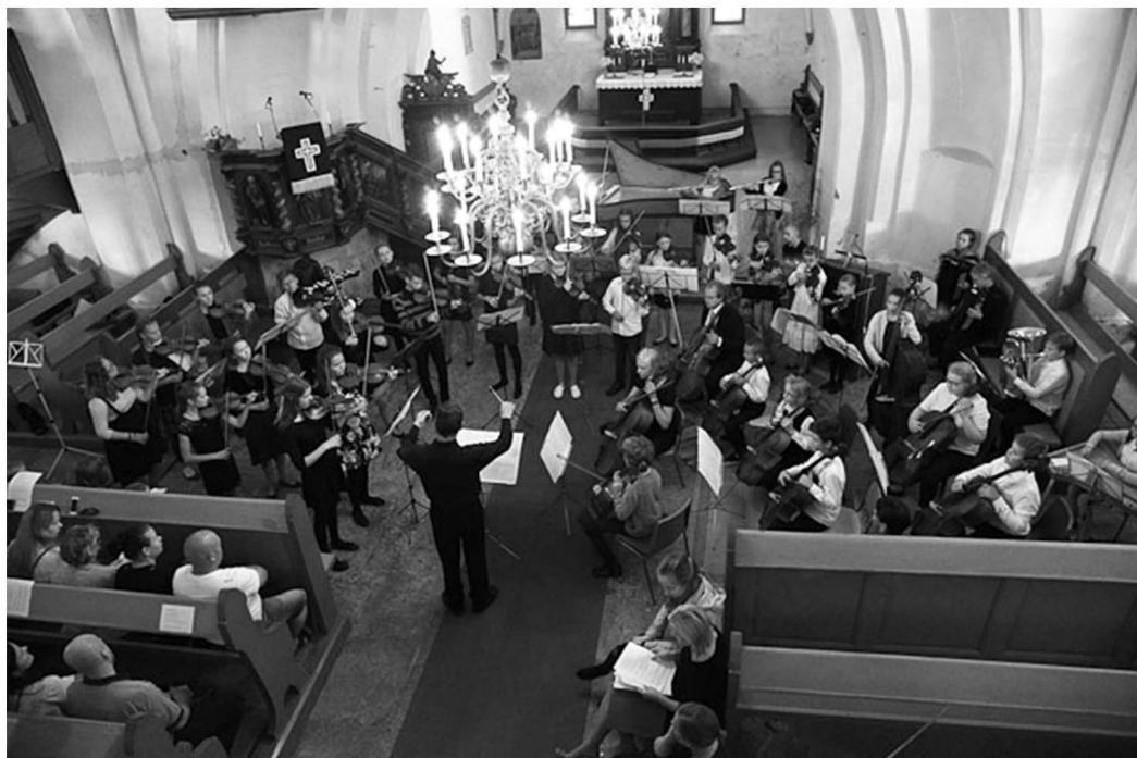
Suvelaagri lõppkontsert „Muusikameri“