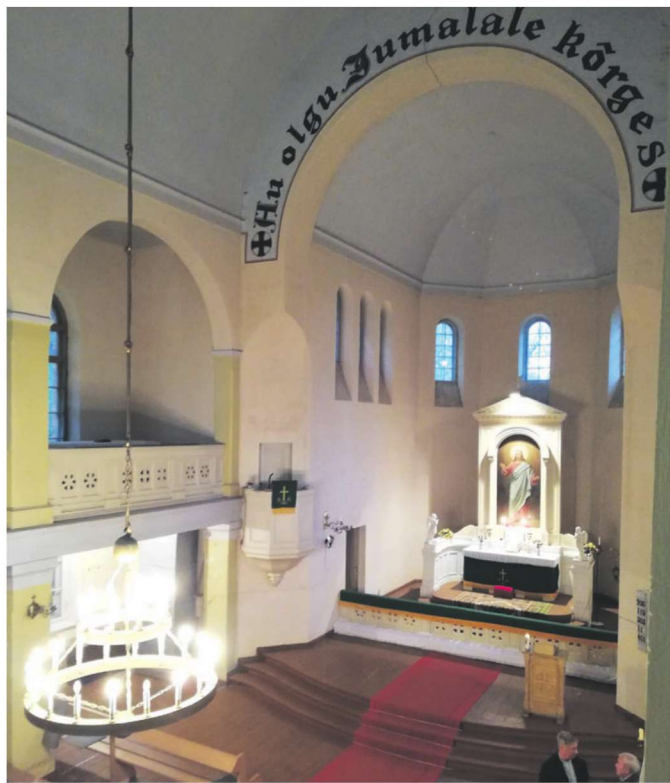
Petseri Peetri kiriku ehitased eestlased ja see pühitseti 1926. aastal. 2 X SIRJE SEMM