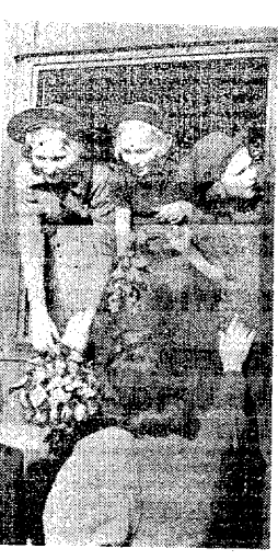
Õtsi sina ka streilitest õnne, mina juba leidisin, ütlevad tütar, siin on juba väikene vagnikana emale liitkimbud.

Raudteelaamadest suvikodudesse siirduvad väikesed reisirajad on enamikus kohal juba tund aega enne rongi väljumist.