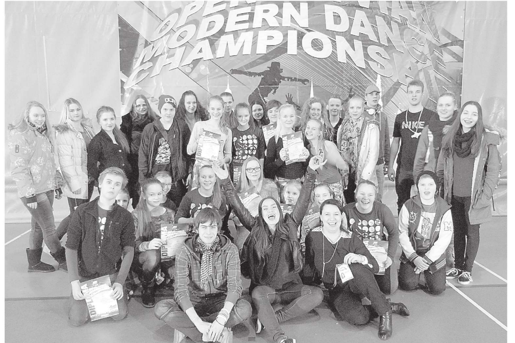
Edukas RN Riias.