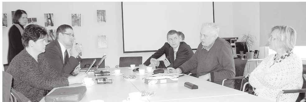
Nõupidamine matkakeskuses oli konstruktiivne, kuigi konkreetset otsust ei sünninud.

“Kas kriitiliselt väikeste õpilaste arvudega koolides me suudame seda oma lastele pakkuda? Me tahame neile pakkuda ju parimat haridust! Vallajuhtide ees on karmid arvud, inimesed aga lähtuvad sageli emot-