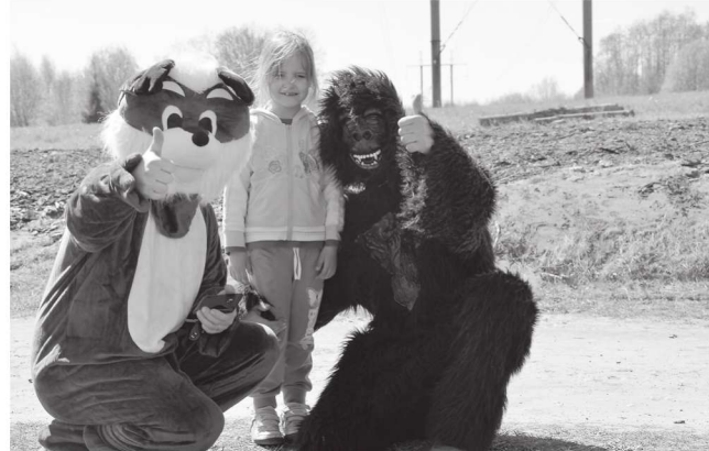
Laste tähelepanu köitnud Reinuvader Rebane ja gorilla.