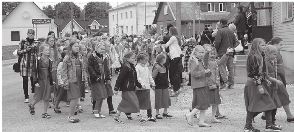
Elva mudilaskoor 2013. aastal Suure-Jaani festivalil rongkäigus.

Koolinoorte festivalid toimuvad laulupidude vahelisel perioodil ja annavad