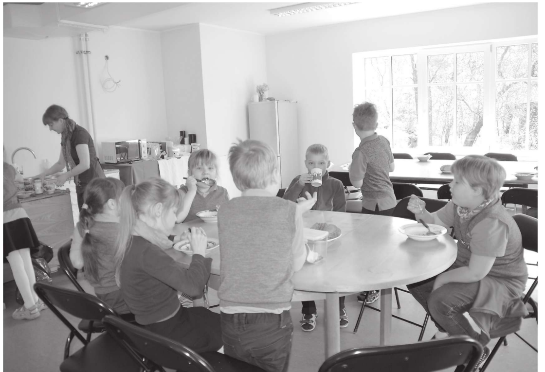
Söögivahetund Peedu uues koolimajas.

Kui ma teisipäeval Peedu uude koolimajja jõuan, on