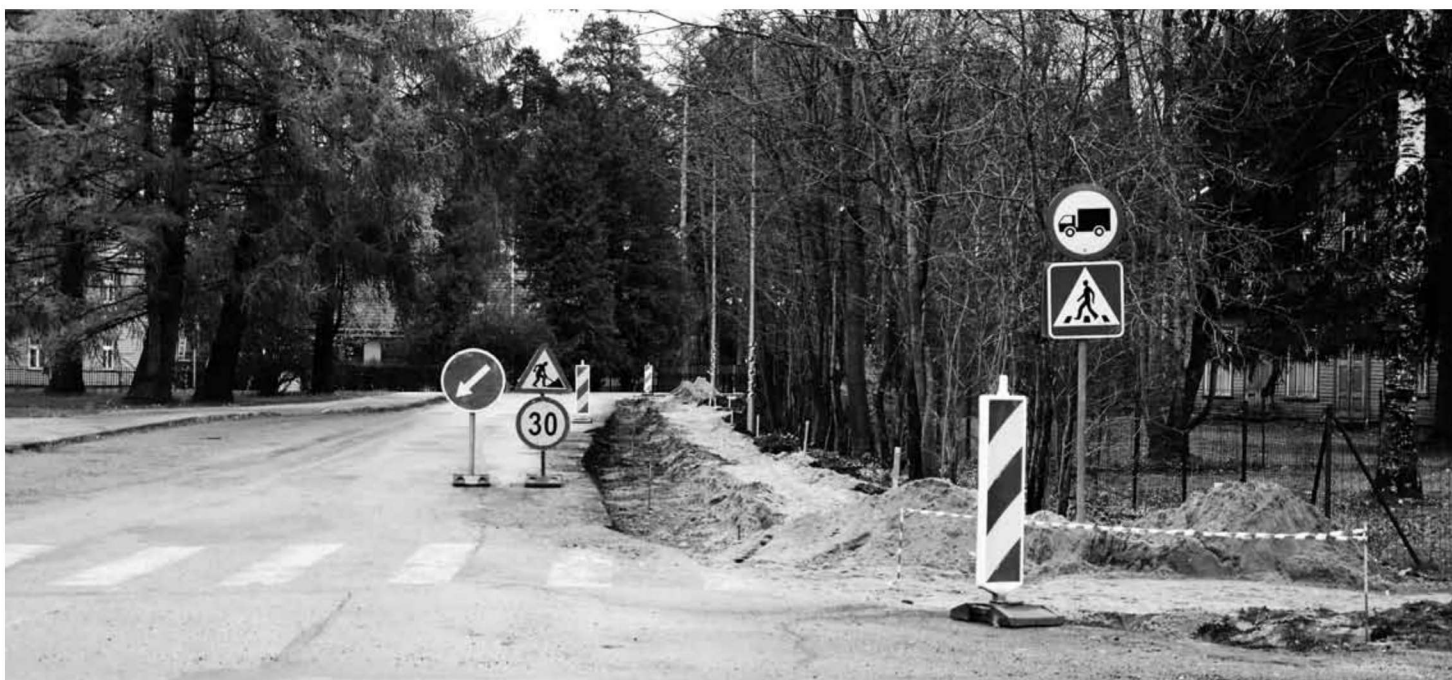
Kui Jaani tänav kõnnitee valmib, kolitakse sinna üle ka Kesk tänav bussipeatused.

Ehituse käigus korrastatakse Elva vallas kokku ligi neli kilomeetrit kergliiklusteid. Viljandi-Rõngu maantee äärsel jalgratta- ja jalgteel ehitust rahastab 85 protsendi ulatuses EAS piirkondade konkurentsivõime tugevdamise toetuse programmi kaudu. Teiste kergliiklusteede ehitus teostatakse Elva valla eelarvest. EPP