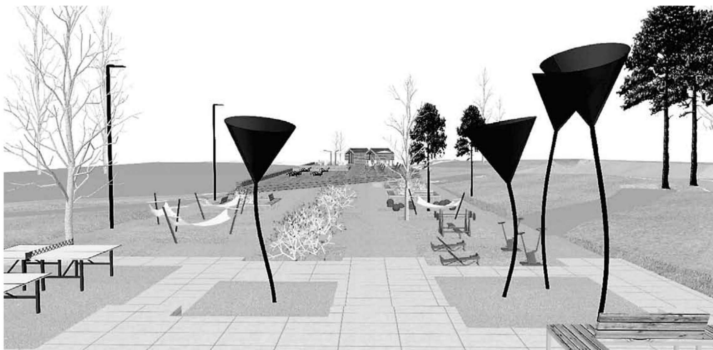
Vallavolikogu andis Elva linna Kesk tänava projektile lisaraha ja roheline tee.