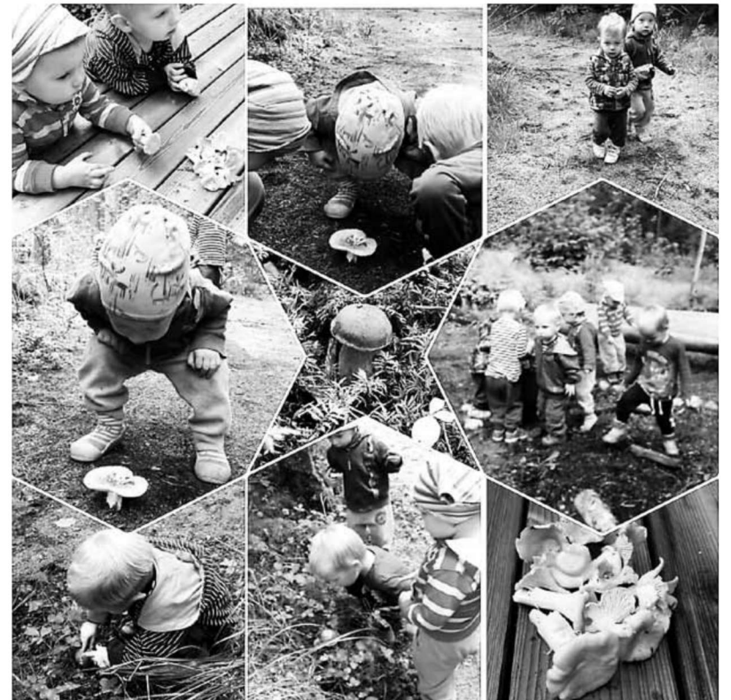
Väikesed avastajad seeneretkel.

"Hea meel on aktiivsetest lapsevanematest meie kogukonnas. Meie eesmärk on omavalitsusena säilitada ja hoida lasteaiakohti, kuid neile lastele, kes peavad veel järjekorras olema, on hoidude kasutamise võimalus väga oluline,"