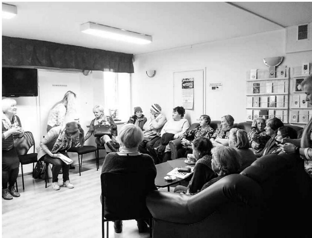
Infopäeva vastu oli kõige suurem huvi Puhja piirkonnas.

Järgneva kahe aasta jooksul on plaanis lisaks kuue-