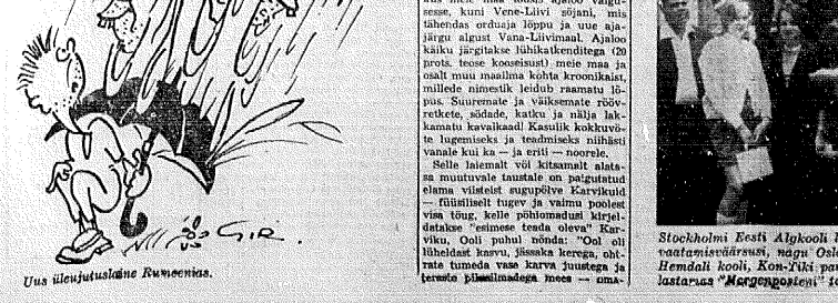
Uus iluülevõtte Ruimeenis.