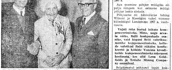
Wilson andis Balti pankade raha võimust katteks m. h. Lennu- ja kullatööstus Siberis. Milline on mung kokkuleppe tagas?

Artiklil siin peetakse lähidalt N. Vene Balti riikide välitulemist, millele kasuame vanaduse koostöökoostöö, massideportimeerimise ja valimiste farsis. Aga kommunistidega natsid ei saanud mingi vahetõrkega häarata Balti keskpunktele poolt