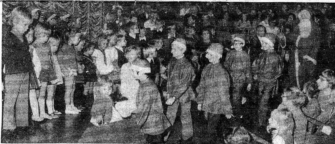
Lasteaia-mudilastele (vasakul) oli suurimaks hetkeks eesti jõuluvana saabumine koos päkapikupoistega (EPL-foto Tippu).