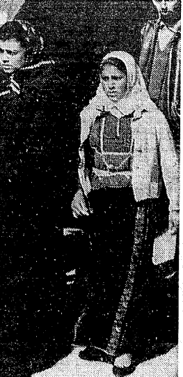
Üks jõulukuise aktuaalseid reistehke: Kristus sünnimõim Jerusalemm. Pildil inimesi selle linna tänavail.