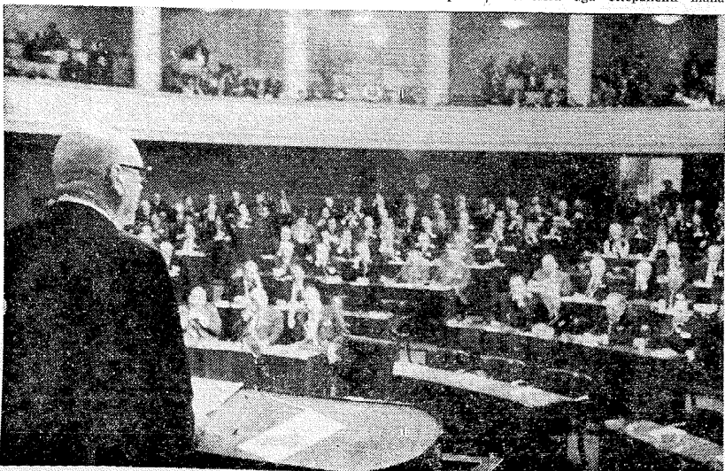
President Urho Kekkonen avamas Parlamentaarse Uniooni konverentsi Helsingis.

Balti Komitee esindajatel oli hiljuti võimalus pikemat veelelda ka teiste USA delegatsioonide liikmetega, samuti Lääne-Saksamaa, Hollandi, Itaalia, Shveitsi ja rea teiste maade delegatsioonide liikmetega.