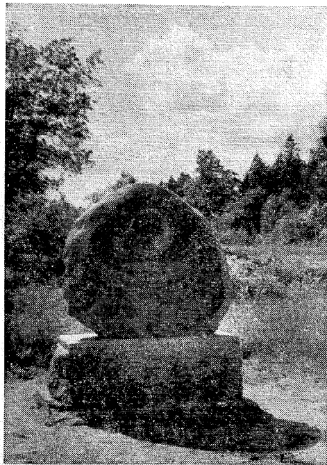
Mälestuskivi Lydia Koidula sünnikohas, Vändra lähedal.