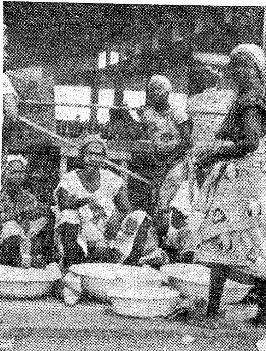
Naisi Aafrika turul — kuumas talves . . .

Ühtlasi jätkab too agar daam oma nüüd juba lubatud saatetege-