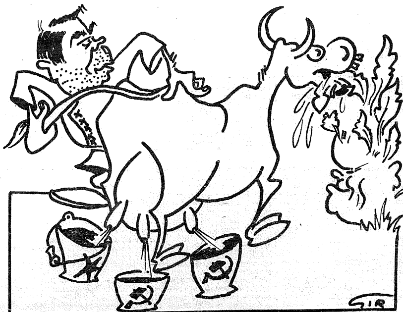
MOSKVA-BONNI tehing andis N. Liidule majanduslike eeliseid: Brezhnev: "... see on otsustav pööre usaldusliku koostöö poole".

Kalleletungide pärast on USA koolides hakatud nüüd õpetajaid varustama transmitter-raadioteega, mille abil on võimalik kooll kantelelele abi kutsuda. Kalleletunge rõõvimiste ja vägistamisest näol on aastaks keskmiselt 500. Osalet teostatatakse kalleletunge kättemaksuks.