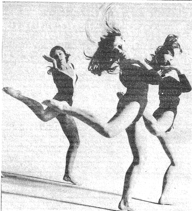
Kalev-Eestienne võimlejad esinemas