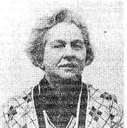
Virge Hint Sünd. 13/3 1918

Maailmalaager Metsakodu tehniliste küsimuste toimkonna üks juhtidest.