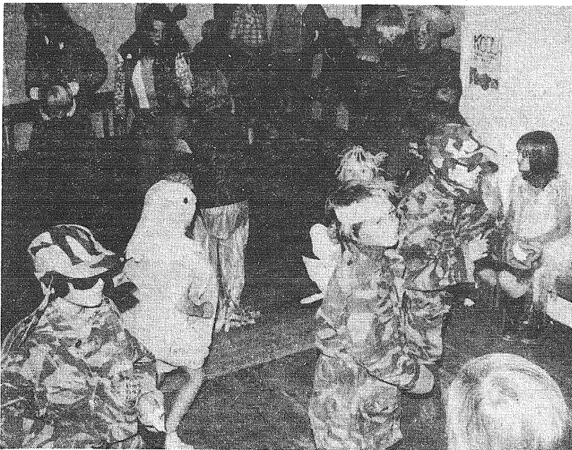
Ojamaa suur maski-ball, kus tantsu löövad tibud, lilled, Vietnami-veteranid, karud ja muud kummalised olevused.