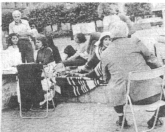
Demonstrant Malmö'sidames. Lülitama mälestussamba jalamil Stortorgetil on massinud end näljastreigi ajaks vaipadesse. Tema

Suurt tähelepanu Lõuna-Rootsi ajalehtedes suutis saavutada lülitama, kes üksinda teostas näljademonstratsiooni Balti küsimuses Helsingi konverentsi ajal Malmö Stortorgetil. Syd-