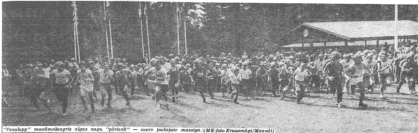
"Vasalopp" maailmalaagris algas nagu "päriselt" — suure jooksjate massiga.