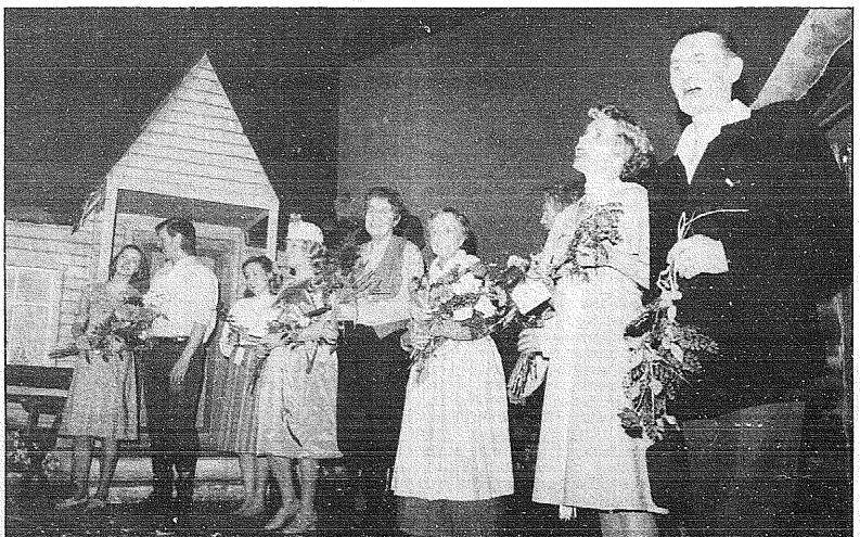
"Mikumärdi" finaali, kus tegelaskond, polkasammul sisse tantsinult, laulab publikule.